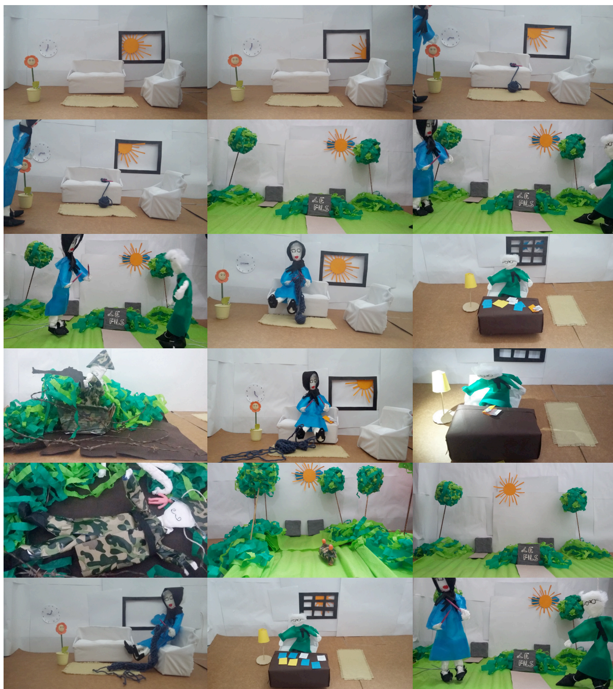
Figura 2: Imagens selecionadas da adaptação em stop-motion do poema Familiale de Jacques Prévert.