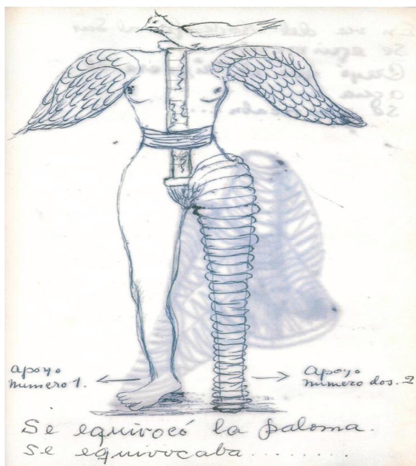
Fig. 3: Lâmina do diário de Frida Kahlo

A vida para Frida também é engano e dor. Eis o acabamento que a artista dá aos acontecimentos dolorosos que marcaram a sua vida: