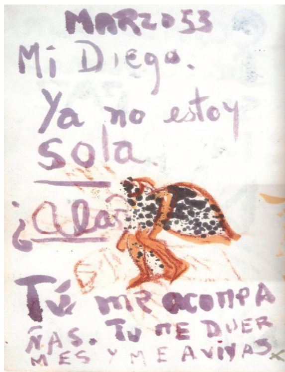
Fig. 4: Lâmina do diário de Frida Kahlo

A lâmina é datada de março de 1953. Misturam-se palavras escritas com traços marcantes ao desenho de um anjo disforme com asa que parece uma grande folha pigmentada. Sobressaem-se os tons violeta da tinta do lápis e o marrom que contorna a figura do anjo. O amor a Diego se expressa na frase afirmativa colocada logo após a data: “Meu Diego. Não estou mais só”. Essas frases encerram o afeto e a esperança de Frida no amor e no companheirismo do amado. Na verdade, esperança que em vários momentos foi frustrada com a solidão e o desamparo advindos das traições de Diego. A pergunta enquadrada na frente do anjo parece se constituir em réplica a alguma afirmação de que ela teria asas para deixar o amado. Ao responder que “tu continuas meu companheiro. Tu me adormeces e me dás vida”, Frida parece axiologicamente se posicionar frente aos pequenos dramas amorosos em que os papéis dos amantes são colocados em dúvida ou são questionados por um dos pares. O conjunto verbo-visual que se apresenta para o leitor é construído na relação dialógica entre enunciados anteriores, uma vez que pressentimos a responsividade, a resposta de Frida a alguma indagação. Também a dialogicidade da construção coloca em cena o dizer ancorado na imagem, na letra-imagem que marca o papel com o sentimento e a paixão da vida dessa mulher: Diego Rivera. Diálogo entre sentimentos, entre textos, entre linguagens.