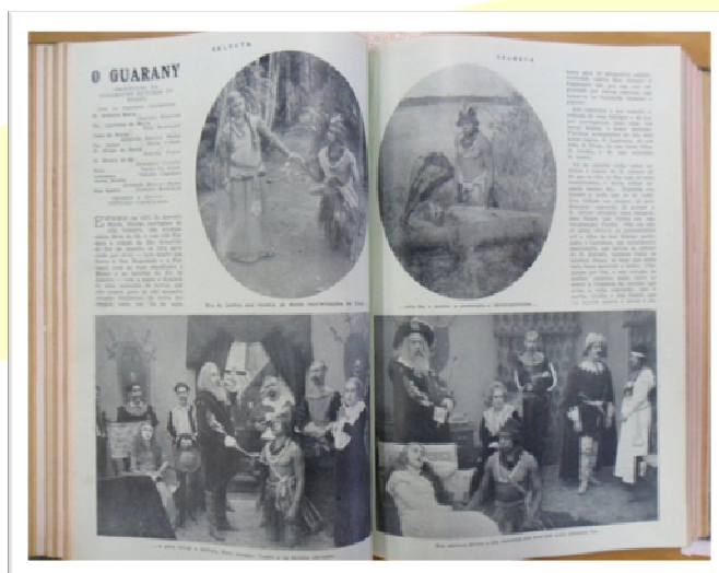
Páginas inteiras da sinopse ilustrada de O Guarany de Capellaro.

Parece que “a forma” do filme de 1926, associada ainda ao “film d’art” realizado em 1916 era antiquada em comparação com o que se fazia no cinema norte-americano tão cultuado naquele momento. Não à toa, depois da exaltação da imprensa em torno do filme co-produzido pela Paramount, há uma grande decepção por parte da crítica e do público. Há a seção do leitor onde estes mostram claro desgosto pela obra: