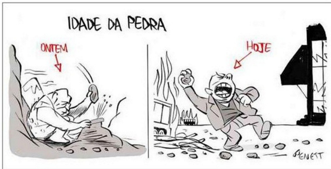
Figura 2. Charge de Benett, publicada na Folha de São Paulo de 13 de junho de 2013.