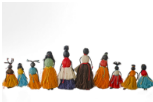
Figura 1: As bonecas pretas do Quilombo de Conceição das Crioulas.

Advertem-nos Munanga e Gomes (2006) que, se da mobilização em torno do Art. 68 da Carta Magna emergiram os quilombos de Frechal (MA), Rio das Rãs (BA), Kalunga (GO), Furnas da Boa Sorte e Furnas de Dionísio (MA), Conceição das Crioulas (PE), entre outros, deve-se sempre cuidar para que esse dispositivo constitucional não alcance tamanha generalização que suprima o que é diverso e particular. É no tocante à relevância de trazer à baila narrativas que nos contem um pouco de um quilombo específico que selecionamos para esse estudo semiótico, o texto seguinte.