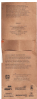
Figura 3: Verso do folder .

Acima, no verso do folder , considerando a mesma ordem com que se observou o anverso, há um texto geral, que apresenta todas as bonecas, dividido em dois blocos por especificações técnicas da boneca, seguido da logomarca e do endereço da AQCC e, por fim, logomarcas de parceiros do projeto artesanal.