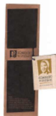
Figura 2: Anverso do folder .

Cada boneca vem dentro de um folder , em cujo anverso observa-se, primeiramente, por sobre um fundo preto, uma faixa central, em que está impressa a logomarca da Associação Quilombola de Conceição das Crioulas – AQCC. Em seguida, vem o nome e uma pequena narrativa da boneca inserida no folder :