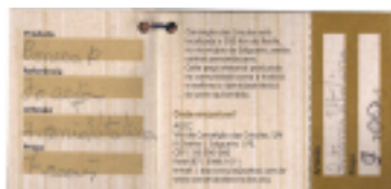
Figura 5: Parte interna da etiqueta

Na parte interna da etiqueta, também em sentido horário, há especificações técnicas da boneca; em seguida, informações sobre o projeto artesanal e sobre o local onde as bonecas podem ser adquiridas; por fim, a assinatura do artesão e o preço da boneca: