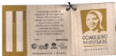
Figura 4: Parte externa da etiqueta

Afixada ao folder vem uma etiqueta. Na parte externa, em sentido horário, há especificações técnicas da boneca; em seguida, informações sobre o projeto artesanal, logomarcas dos parceiros e, por fim, a logomarca da AQCC: