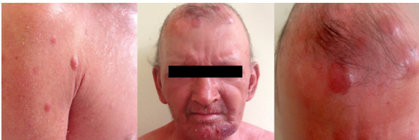
Figura 3. Lesões tumorais em face e membro superior esquerdo