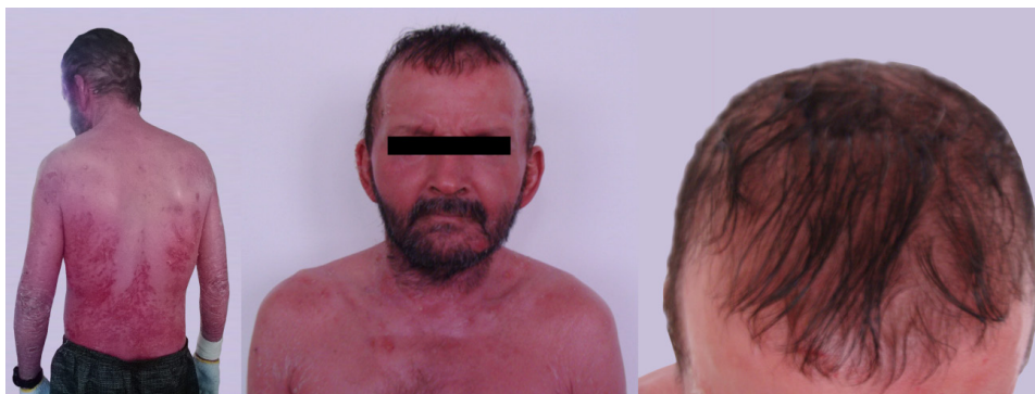
Figura 1. Eritrodermia e marcante alopecia