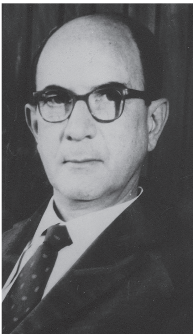
Figura 1. O Professor Antonio de Barros de Ulhôa Cintra, em 1950, ao assumir a 1ª Cadeira de Clínica Médica e iniciar, a partir do Serviço de Moléstias da Nutrição, a Endocrinologia em São Paulo.

Estagiários começaram a vir de vários pontos do país, cursos de aperfeiçoamento foram organizados, com participações em Simpósios, Congressos nacionais e internacionais. Alguns anos mais tarde o Serviço de Moléstias de Nutrição foi oficialmente incorporado à 1ª Clínica Médica.