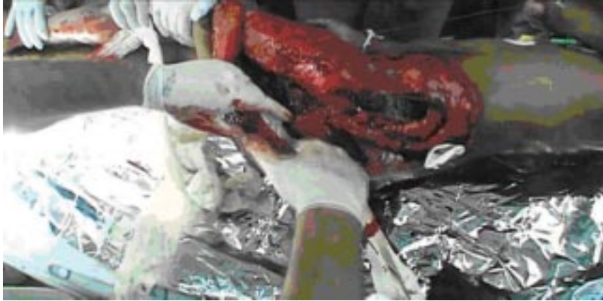
Figura 1. Descolante.