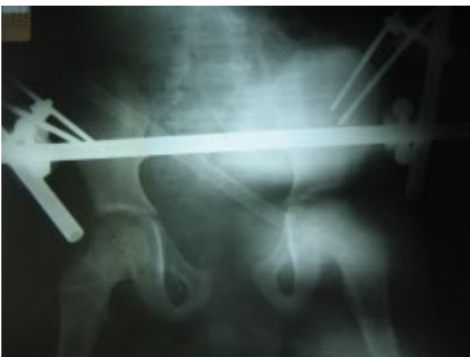
Figura 3. Fixador externo.