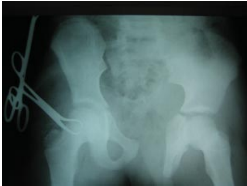
Figura 2. Fratura complexa com disjunção sínfise púbica e sacroilíaca bilateral.