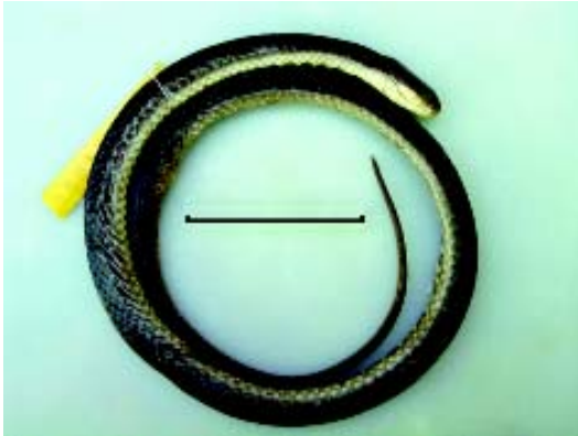
Figura 1 - Vista dorsal do holótipo (MCP 15380 ♀) de Helicops tapajonicus sp. nov. Escala = 50 mm.