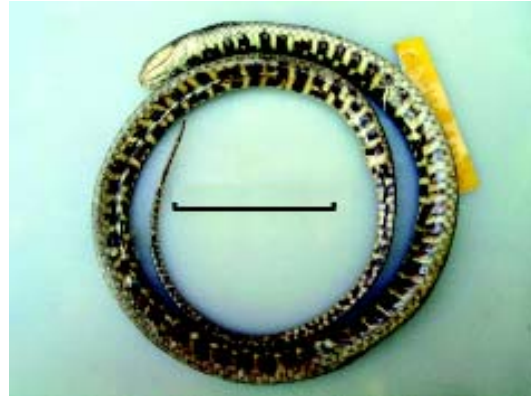
Figura 2 - Vista ventral do holótipo (MCP 15380 ♀) de Helicops tapajonicus sp. nov. Escala = 50 mm.