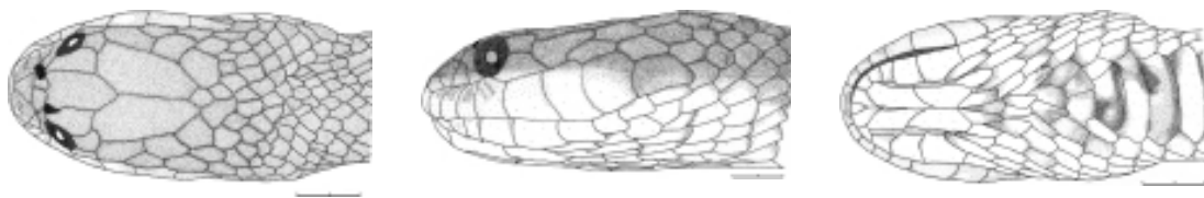
Figura 3 - Cabeça de Helicops tapajonicus sp. nov. (holótipo, MCP 15380 ♀) em vistas (A) dorsal, (B) lateral e (C) ventral. Escala = 5 mm.