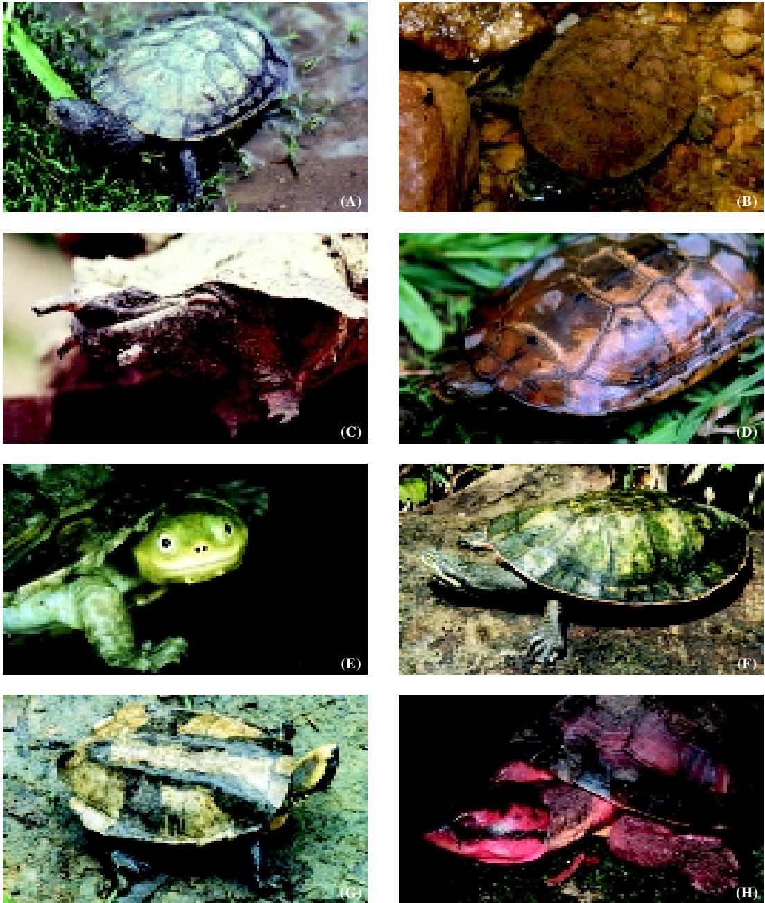
Figura 1 - Algumas espécies de Chelidae que ocorrem no Brasil. (A) Batrachemys tuberculata, Exu, PE, (B) Bufocephala vanderhaegei, Chapada dos Veadeiros, GO, (C) Chelus fimbriatus, Manaus, AM, (D) Hydromedusa maximilliani, Serra do Caraça, MG, (E) Mesoclemmys gibba, Rio Ajarani, RR, (F) Phrynops geoffroanus, Rio Formosa, RO, (G) Platemys platycephala, P. E. Guajara Mirim, RO, (H) Rhinemys rufipes, Manaus, AM