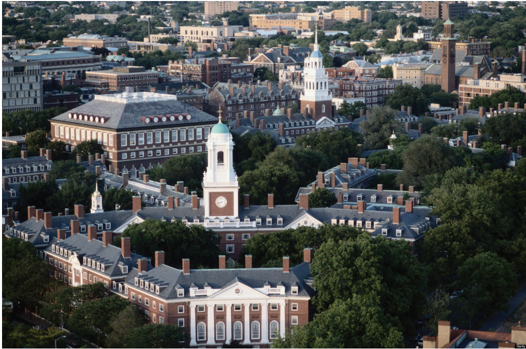
Universidade Harvard, localizada em Cambridge, Massachusetts, Estados Unidos.

entrevistas e foi convidado para discutir o assunto em importantes instituições, inclusive nas universidades que tiveram sua história analisada no trabalho. O reconhecimento da seriedade, ineditismo e pertinência de sua investigação foi demonstrado pelos vários prêmios recebidos, entre eles o Hurston/Wright Legacy 2014 award .