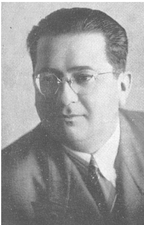
Arthur Ramos (1903-1949)

escravismo na formação da colônia, inclusive com desenvolvimentos fundamentais em termos do que é a sociabilidade, a cultura e o contraponto escravo-senhora. Esta questão pode ser encontrada parcialmente está em trabalhos de Roger Bastide e de forma mais elaborada em textos de Florestan Fernandes.