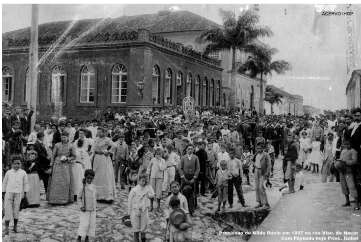
Imagem 3: Procissão de N. S. do Rocio em 1897. Acervo IHGP. Disponível em: http://api.ning.com/files/aa3rmQt8wqNN3w5r*aPbtoIUEYj3ub0LoBcRCBSMIEIvrGDVWtwZ0gpynpkI0Q7-TDdZDtJdcWTPAeMgLINNnJ-T6zinyKp*/100nsrocio00.jpg?width=737&height=488 . Acesso em 08/02/2012.

Um dos primeiros registros imagéticos da procissão em louvor a Nossa Senhora do Rocio data de 1897 e podemos perceber sua importância pelo expressivo número de pessoas que dela participavam (Imagem 3). Também em 1902, há o registro da procissão (Imagem 4).