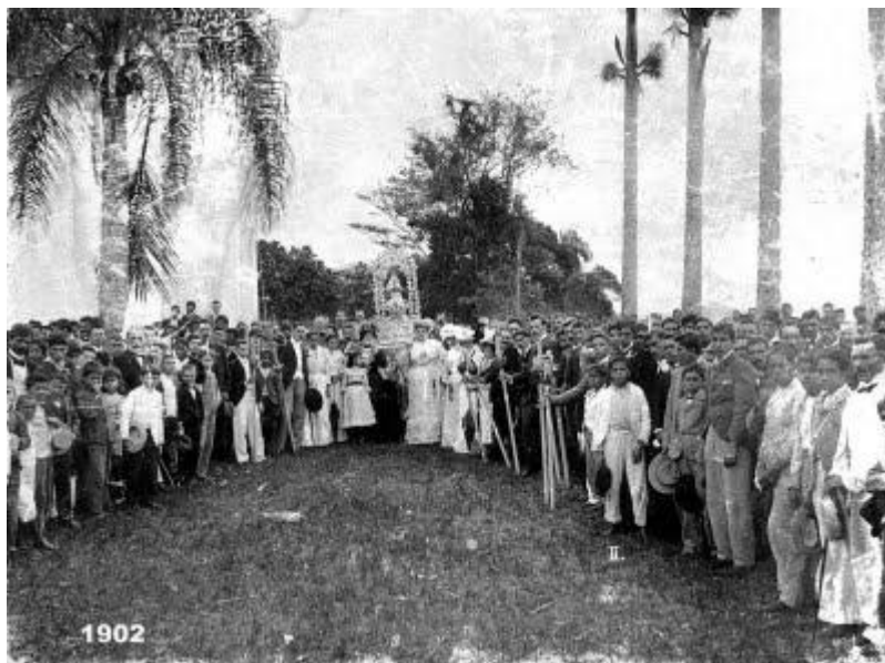
Imagem 4: Procissão em homenagem a N. S. do Rocio, em Paranaguá-PR.

Disponível em: http://2.bp.blogspot.com/-YAUGHONrmmM/TfqmZyBDQqI/AAAAAAAAA7M/msxOs8n79-I/s400/Rocio.jpg . Acesso em 05/02/2012.