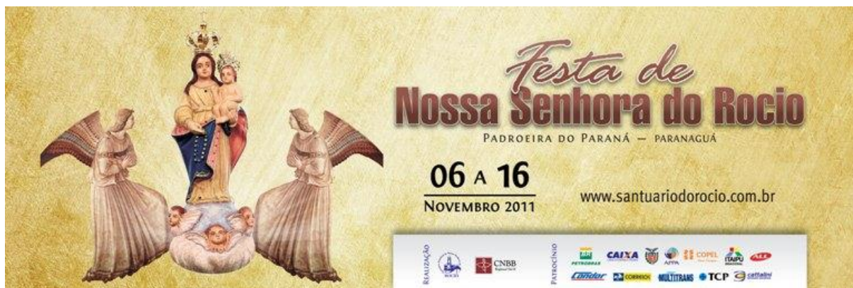
Imagem 5: Cartaz da Festa do Rocio em 2011.