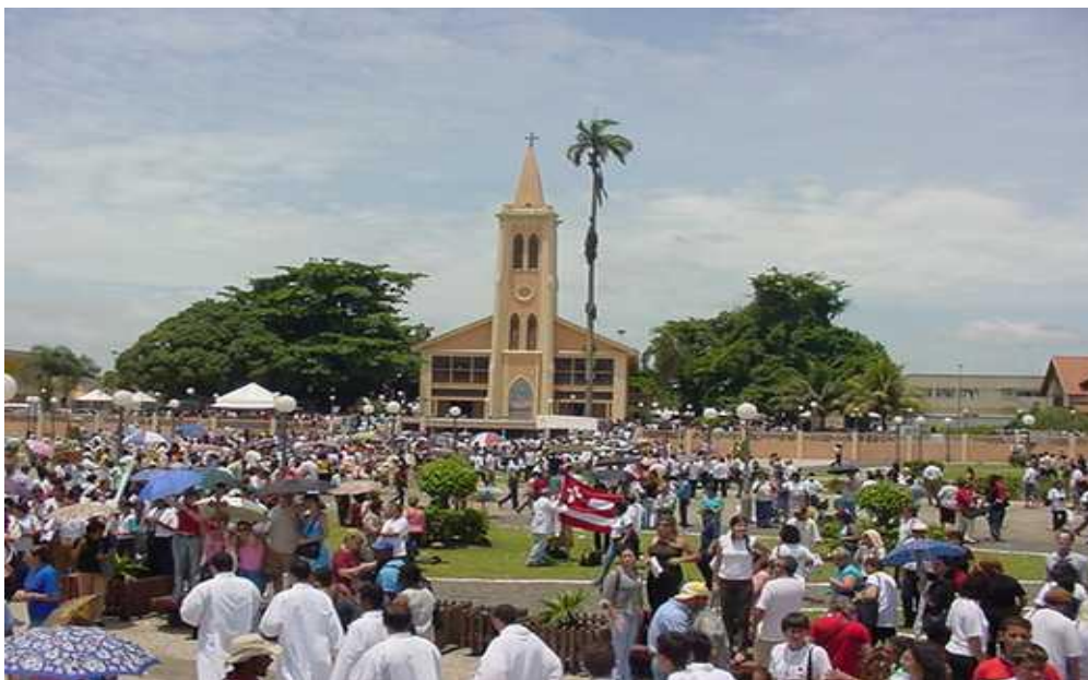
Imagem 2: Festa de Nossa Senhora do Rocio.

http://www2.cnbbs2.org.br/ImgGallery/albums/Festa_Nossa_Senhora_do_Rocio_2002/DSC00843.JPG