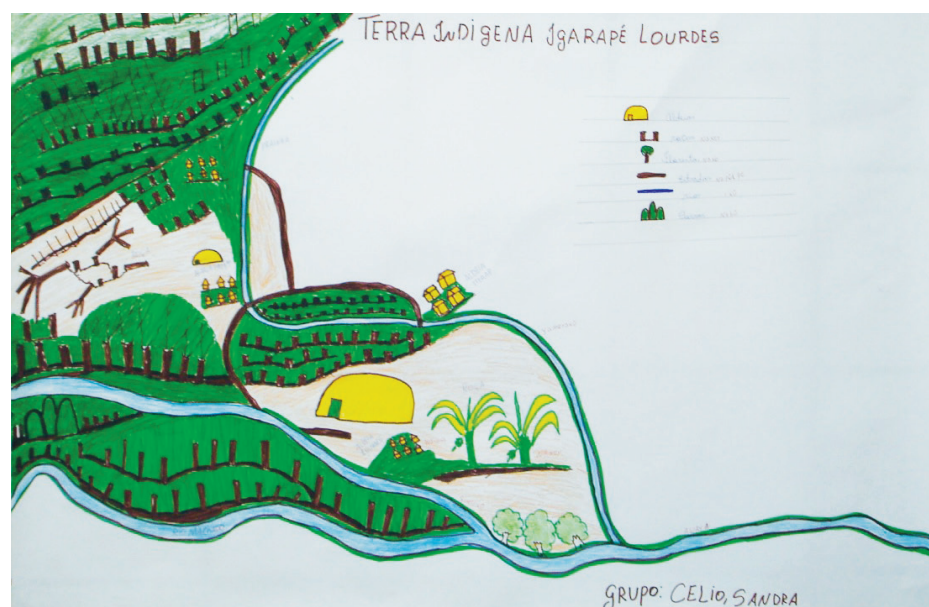
Figura 2 – Mapas mentais elaborados pelos indígenas para espacialização da flora.