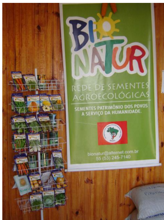
Foto 3 - Produção de sementes agroecológicas pelos assentados de Candiota e Hulha Negra – RS.

Para a inserção nesse sistema agroecológico, os assentados devem construir um processo de transição entre o convencional e o agroecológico, o diretor da Bionatur ainda ressalta essa transição: