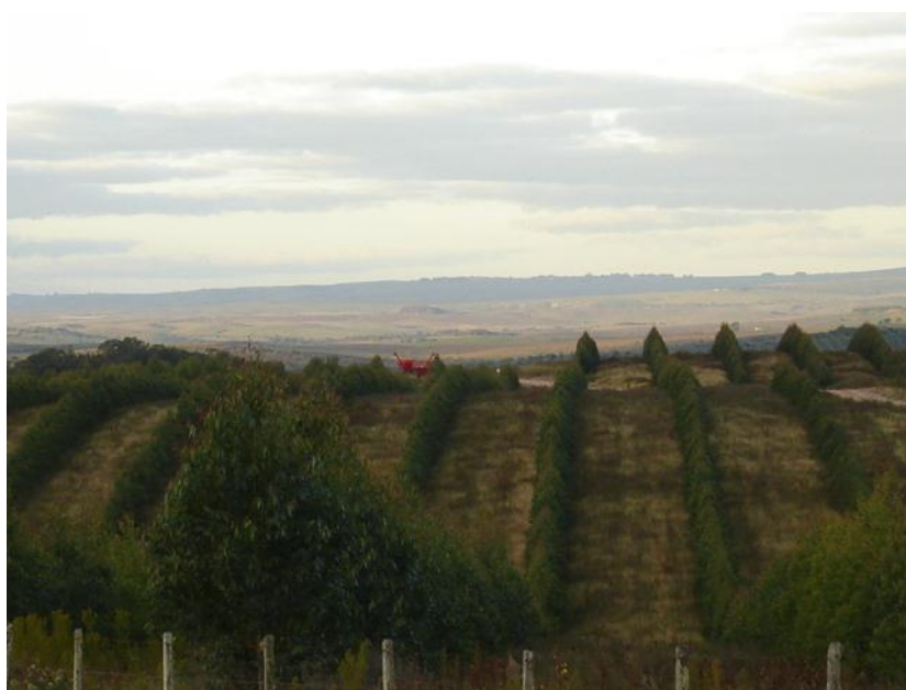
Foto 1 – Floresta de eucalipto no município de Candiota, Rio Grande do Sul.

Nos municípios de Candiota e Hulha Negra existem propriedades rurais que desenvolvem a prática do florestamento de pinus, eucalipto e acácia (Foto 1).