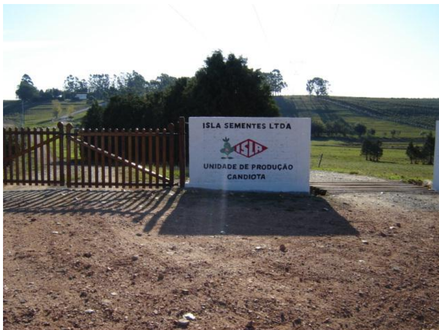
Foto 2 - Unidade de Produção de uma empresa convencional de sementes em Candiota.

Dessa forma, em um encontro regional de assentados no final de 1996, discutiu-se uma alternativa para romper com a forma tradicional de produção das sementes, uma forma que não utilizasse insumos químicos e que não tornasse o agricultor familiar dependente de produtos químicos e do mercado.