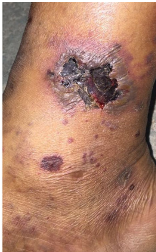
Figura 1: Lesão perna Direita.

Ao exame: Lesões ulceradas e infiltrativas de fundo necrótico, com bordas irregulares, deprimidas e eritematosas em terço distal de MMII, além de máculas violáceas e lesões bolhosas extensas na face anterior e posterior dos MMII (Figuras 1, 2, 3 e 4).