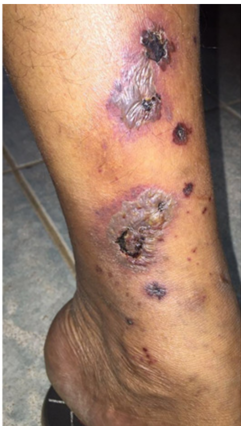
Figura 4: Lesão perna direita

A biópsia de pele é compatível com atrofia branca ou vasculopatia livedóide. Os cortes histopatológicos evidenciaram epiderme com hiperqueratose com focos de paraceratose, hipergranulose e espongiose. Na derme papilar observa-se vasocongestão, edema, leve infiltrado linfocítico de localização perivascular e intersticial, com extravasamento eritrocitário e presença de hemossiderófagos. Nota-se ainda aumento do número de vasos dérmicos com degeneração fibrinóide das paredes, além de tampões de fibrina intraluminais (Figuras 5 e 6).