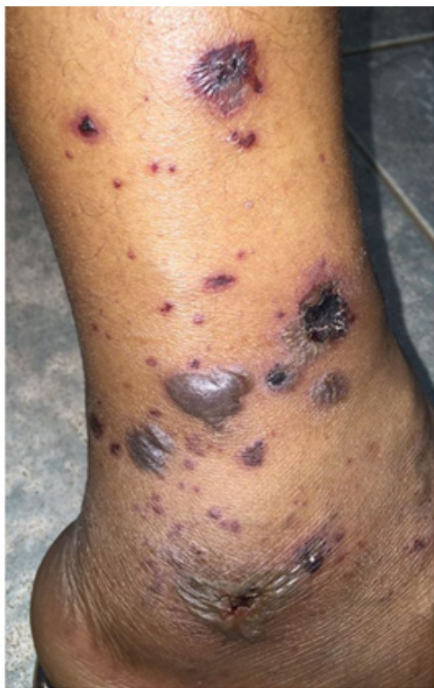
Figura 3: Lesão em perna Esquerda.