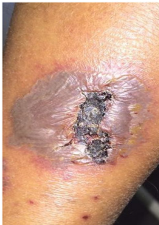
Figura 2: Lesão panturrilha Direita.