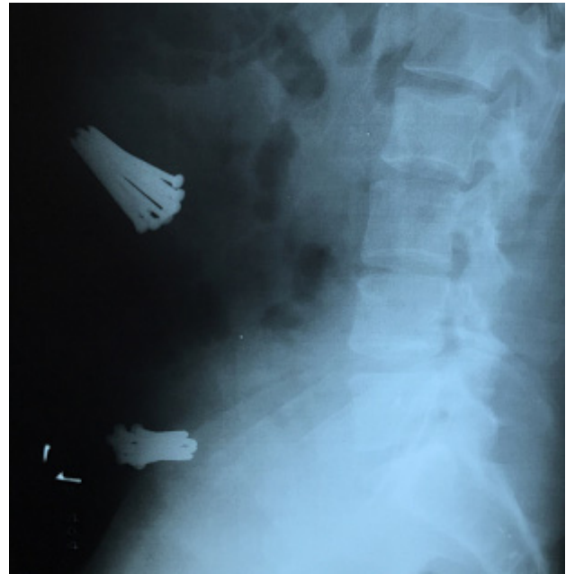
Figura 4: Radiografia de perfil com presença de corpos estranhos.