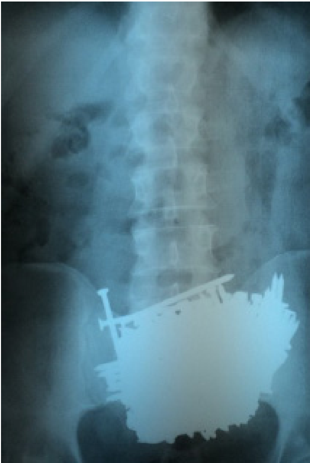
Figura 2: Radiografia de abdome evidenciando bezoar em região pélvica.

Após 5 meses da primeira cirurgia, o paciente retornou ao HUSF com relato de nova ingestão de pregos e sintomatologia dolorosa abdominal, sendo então submetido a nova laparotomia exploradora, com retirada de 41 pregos em corpo gástrico, com tamanho variando de 5 a 15 centímetros. Dois meses após esta segunda cirurgia, o paciente foi internado, relatando recidiva de ingestão de pregos (aproximadamente 20 unidades), sem queixas álgicas. Foram realizadas radiografias pósterio-anterior (PA) e perfil de abdome, por meio das quais se constatou a presença dos corpos estranhos em locais distintos, região gástrica e de jejuno (figuras 3 e 4).