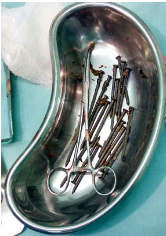
Figura 5: Pregos removidos.

Realizou-se então a terceira laparotomia exploradora e foram retirados 10 pregos em região gástrica e 10 em porção medial jejuno (figura 5). No quinto dia de pós-operatório, o paciente evadiu do hospital.