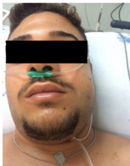
Figura 1: Enfisema Subcutâneo em região cervical e hemiface esquerda

Ao exame físico, encontrava-se em regular estado geral, consciente e orientado, taquidispneico, presença de enfisema subcutâneo em toda a região cervical e hemiface esquerda (Figura 1), ritmo cardíaco regular em dois tempos, bulhas hipofonéticas, murmúrio vesicular diminuído difusamente, à percussão som claro pulmonar bilateralmente e sibilos esparsos. Sinais vitais: pressão arterial 160x100 mmHg, frequência cardíaca 90 bpm e SatO 2 94%.