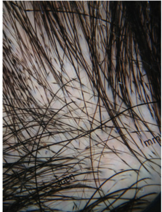
Figura 5: alternância entre bandas largas e estreitas das hastas capilares (Tricoscopia da paciente do caso 2)

(figura 3) e coiloníquia (figura 4). À dermatoscopia, visualizamos alternância entre bandas largas e estreitas das hastas capilares (figura 5). Dadas as características clínicas, foi feito o diagnóstico de monilethrix e feitas orientações quanto a doença.