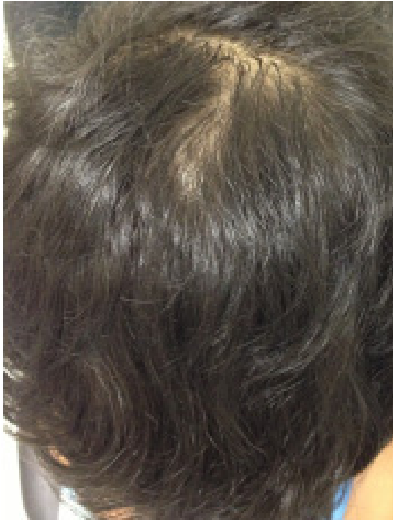
Figura 3: discreta rarefação no vértex (paciente do caso 2)

Paciente do sexo masculino, seis anos, procurou atendimento acompanhado do responsável com queixa de cabelos quebradiços. Ao exame, observamos discreta rarefação no vértex capilar