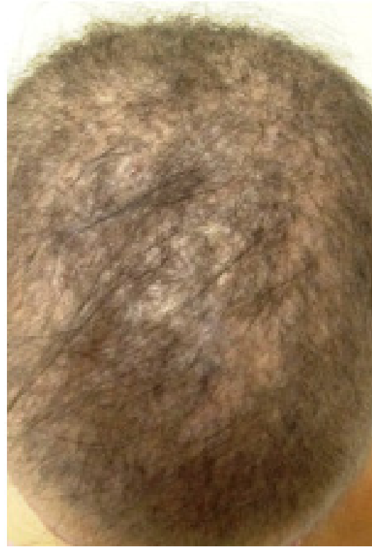
Figura 1: Hastes capilares fraturadas observadas na paciente do caso 1

Paciente do sexo feminino, nove anos, procurou atendimento médico acompanhada de sua mãe com queixa de cabelos finos desde o nascimento. Ao exame, observamos hastes capilares fraturadas (figura 1) e ceratose folicular na região cervical posterior (figura 2). À dermatoscopia, visualizamos nódulos elípticos no eixo do cabelo, regularmente separados por entrenós estreitos. Diante dos achados clínicos e dermatoscópicos, concluímos tratar-se de monilethrix. Foram feitas as orientações pertinentes e abordados algumas opções terapêuticas, porém a paciente descontinuou seguimento no ambulatório.