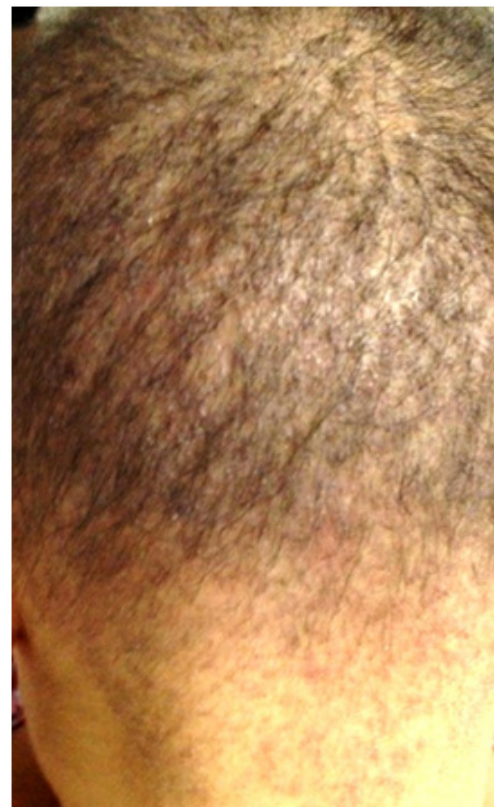
Figura 2: ceratose folicular na região cervical posterior identificada na paciente do caso 1