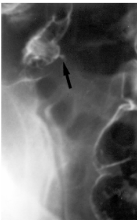
Figura 2: Enema opaco. Falha de enchimento do segmento distal do apêndice (a seta indica a base do apêndice contrastado).