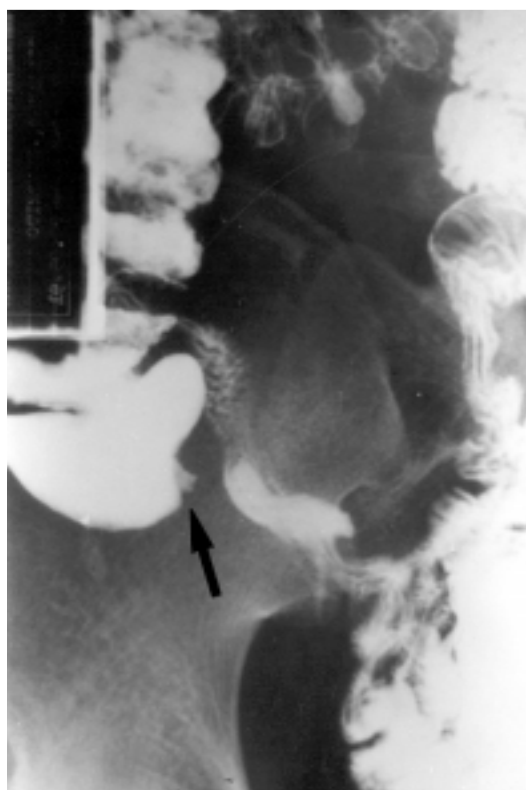
Figura 3. Enema opaco. Irregularidade do contorno do ceco (seta indica a base do apêndice, contrastada levemente)