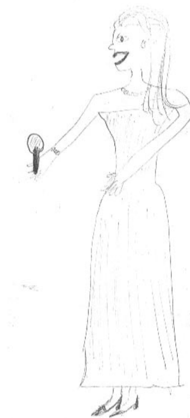
Figura 1: Figura humana feminina executada por Joana. O fato de a figura humana feminina desenhada estar observando o reflexo de sua imagem em um espelho sugere uma preocupação exacerbada com a própria aparência e pode ser entendido como um indício de narcisismo primário.

A representação mental que as participantes do presente estudo têm de si mesmas também parece ser influenciada por sentimentos de inferioridade e inadequação associados a uma acentuada fragilidade egóica, uma vez que a maioria das figuras humanas coligidas é de tamanho diminuto, pouco integrada e pobre em detalhes. Essa influência provavelmente ocorre de modo inconsciente, pois fomenta a utilização de mecanismos de defesa arcaicos que produzem uma imagem corporal compensatória – como se vê na Figura 2 – e indicam que o psiquismo das examinadas opera sob a égide do narcisismo primário. Mas, tal narcisismo é predominantemente voltado para compensar um marcado déficit de auto-estima, resultado de uma imagem de si mal integrada e primitiva, caracterizando, assim um narcisismo de morte, e não a serviço da vida.