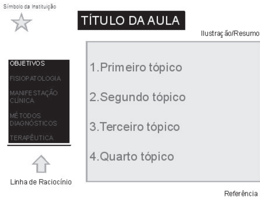
Figura 2: Modelo de diapositivo para conciliar SEQÜÊNCIA e ILUSTRAÇÃO (Parte 1)

A porção superior direita ilustra uma sugestão do posicionamento do emblema da instituição e o restante da mesma linha é ocupado pelo título da figura. No corpo do diapositivo, observa-se na porção esquerda um pequeno quadro contendo a palavra OBJETIVOS salientada. Este quadro irá servir como referência do ponto da apresentação para palestrante e platéia. O restante do corpo do diapositivo é utilizado para ILUSTRAÇÃO. Neste exemplo, colocam-se os diversos tópicos que serão abordados para se cumprir os objetivos. Na porção inferior direita do diapositivo há uma indicação de onde se inserir a referência do que é exposto.