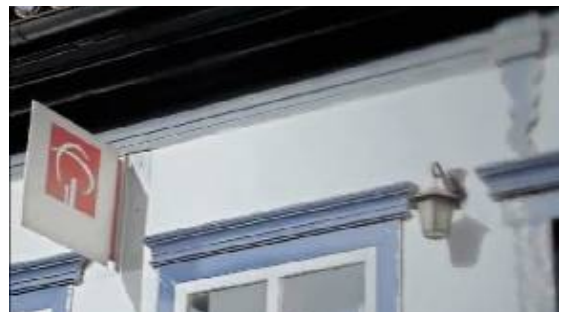
Figura 5 – fachada de casa histórica, provavelmente de Sabará, MG, identificada com o logotipo do Bradesco.