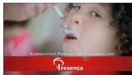
Figura 8 – imagem final da criança sendo alimentada pela merendeira: o discurso sobre a economia se apoia no uso estratégico dos afetos.

5. BRADESCO Árvore. Direção de Luis Pinheiro. São Paulo: Agência Neogama BBH/Equipe Mixer. Brasil, 2009. 90 seg, VHS, Son. Color. Disponível em: < http://www.youtube.com/watch?v=VpvYkbyXIR4&feature=channel_video_title >. Acesso em: 9 mar. 2011.