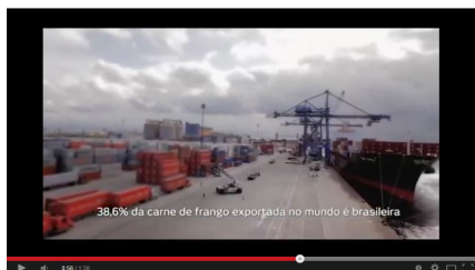
Figura 6 – imagem do Porto de Paranaguá, ancorado pelo discurso econômico.