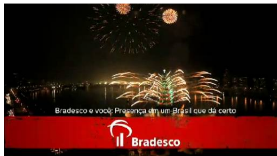
Figura 11 – a apoteose do discurso do Bradesco, no espetáculo de luzes e fogos de artifício da árvore de Natal.