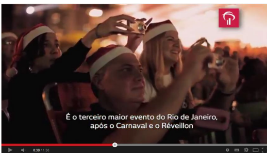
Figura 10 – o público assiste fascinado ao espetáculo de luzes e fogos de artifício da árvore do Bradesco.

A campanha Brasil Presença do Banco Bradesco, em nossa análise, revela-se um discurso construído de forma seriada, que estabelece encadeamentos internos a cada filme e em suas interdiscursividades. Nesta trama de significados, emergem sujeitos que são alinhados em um território demarcado pela presença da instituição bancária, como o grande elo invisível que rege o desenvolvimento do país. De acordo com Ferrara,