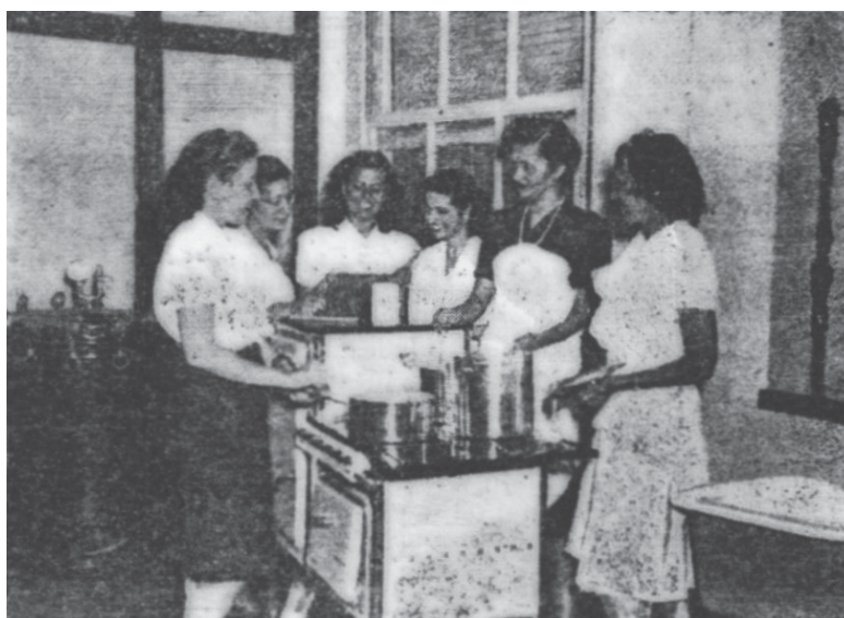
Figura 1: Alunas da Escola Técnica de Assistência Social Cecy Dodsworth numa aula de treinamento (PDF, 1944:9).