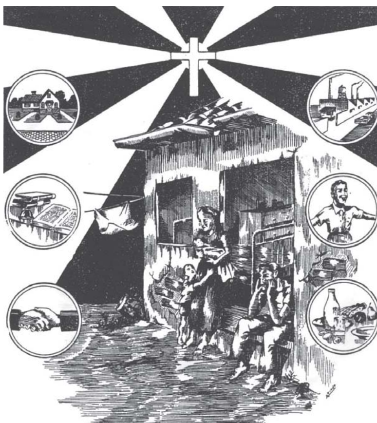
Figura 2: Capa do primeiro número da Revista Serviço Social (REVISTA SERVIÇO SOCIAL, 1939: capa).

O SERVIÇO SOCIAL AJUDARÁ ESTA FAMÍLIA A DESCOBRIR: