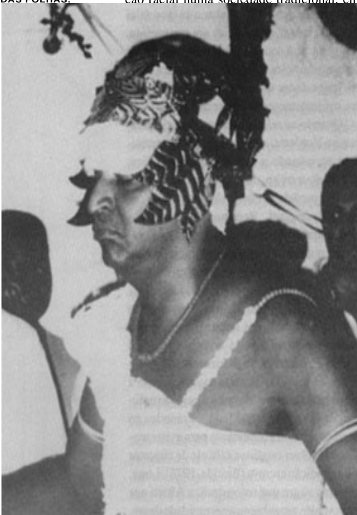
OSSÃE, ORIXÁ DAS FOLHAS.

que as estruturas sociais tinham mais o aspecto de estamentos que de classes, agora ele tem o sentido de escolha pessoal, livre, intencional: alguém adere ao candomblé não pelo fato de ser negro, mas porque sente que o candomblé pode fazer sua vida mais fácil de ser vivida, porque então talvez se possa ser mais feliz, não importa se se é branco ou negro. Estimativas recentes obtidas através de surveys nacionais atestam que os negros ainda hoje marcam maior presença nas religiões afro-brasileiras, onde somam, entre pardos e pretos, 42,7% da população adulta brasileira. Sua presença relativa sobe ainda mais no candomblé, originariamente a grande fonte de identidade negra, em que chegam a 56,8% — a única modalidade religiosa em que o negro é a maioria dos fiéis. Mas há muito branco nas religiões afro-brasileiras (51,2%) e mesmo no candomblé, em que representam 39,9%. Em números absolutos, os maiores contingentes negros são, evidentemente, católicos e em segundo lugar, evangélicos (Prandi, 1995).