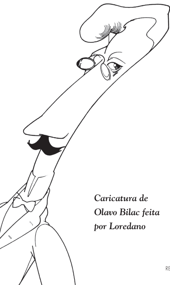
Caricatura de Olavo Bilac feita por Loredano

Não há, como se sabe, oposição entre a afirmação da autonomia da arte e o modernismo, por mais que ela esteja nesse caso ancorada no cânone do parnasianismo; contrariamente, a autocompreensão do moderno emergiu da crítica estética modernista que afirmava a independência em relação aos modelos do passado. Por isso, o princípio da “arte pela arte” foi recriação típica das vanguardas modernas, a despeito de, no Brasil, o movimento modernista ter se identificado com os problemas da nação e, por essa via, com a formação da nacionalidade, o que pressupõe o perquirir as nossas raízes históricas. Por essa razão, se algum desvio ocorreu no sentido da afirmação das diretrizes da arte moderna entre nós, foi antes produto das gerações seguintes, revelando o quanto os intelectuais e artistas da denominada “República das Letras” foram pioneiros na abertura de espaços de atuação, bem como estavam compassados com as novas tendências que emergiam nas capitais mundiais da cultura. Questão de outra ordem é a consideração dessa face antemoderna do nosso modernismo, a espelhar mais uma das nossas conhecidas originalidades.