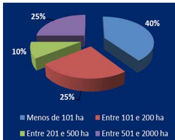
Gráfico 1 – Área total das fazendas dos Campos de Cima da Serra e Fronteira Oeste