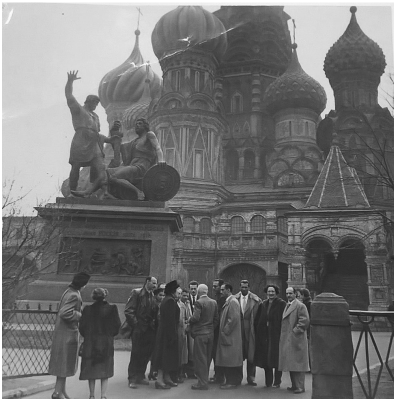
Figura 4 – A comitiva brasileira e a Catedral de São Basílio, na Praça Vermelha. Referência: GR-F14-014

A resposta a esse questionamento passa necessariamente pela dimensão reflexiva do livro, traço pouco comum a um relato de militante em tempos de aguda ortodoxia, que dá ensejo a um olhar mais apurado e a hesitações bastante reveladoras. Tal dimensão aparece claramente quando o narrador discorre sobre sua passagem por Praga, onde trava um primeiro contato com a Sociedade para as Relações Culturais da URSS com os Países Estrangeiros, a VOKS: