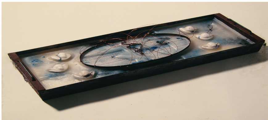
Figura 2: Anna Bella Geiger, Mapa mundi com ventos I , 1995, 20 × 59 × 10 cm.

Diferentemente do cartógrafo, o artista não se interessa pela medida em si, mas empenha-se, ao contrário, em confundi-las. Esse ato de confundir pode ser dinâmico e pode-se pensar o mapa como um diagrama que desenha multiplicidades espaço-temporais, de tal modo que o mapa se torna um traçado de relações de força, um sismógrafo de intensidades, a figuração de coisas efêmeras e quase inapreensíveis. Um mapa da artista brasileira Anna Bella Geiger, Mapa mundi com ventos I (Figura 2), representa os ventos que atravessam a América do Sul, isolada sobre o mar, e que parecem manter todo o continente em suspenso, como parênteses no meio do mundo.