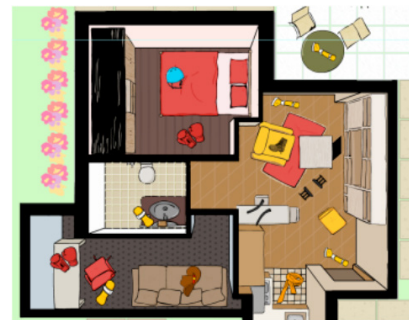
Figura 5 – Cenário do jogo Casa bagunçada

No terceiro e último, o usuário circula por um cenário de uma casa com seis cômodos e deve achar os equipamentos de reabilitação escondidos (Figura 5). Esse jogo reforça o aprendizado sobre o uso e o cuidado com as órteses que fazem parte da sua rotina diária.