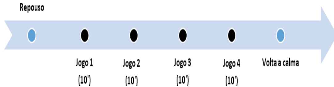
Figura 1 - Etapas da sessão experimental; Seta pequena em azul: medidas contínuas da frequência cardíaca; Seta em laranja: medidas de pressão sanguínea ao final de cada jogo; Quadrado negro: repouso entre os jogos na sessão