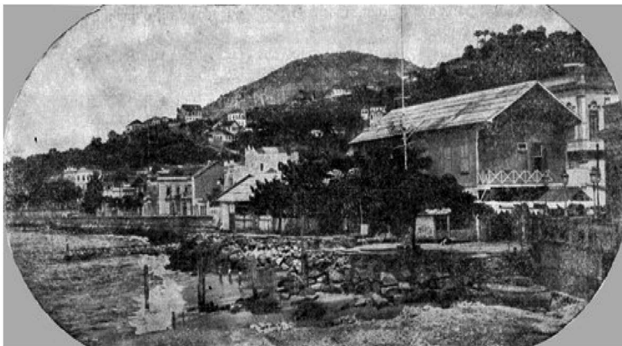
Sede do Clube de Natação

uma ideia, o prédio branco que se situa atrás da sede é do Silogeu Brasileiro, onde hoje está o prédio do Instituto Histórico e Geográfico Brasileiro.