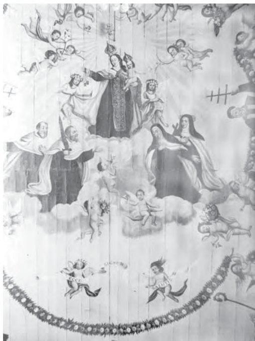
Ilustração I - Teto da igreja do Carmo de Itu. Padre Jesuíno do Monte Carmelo. Foto de Germano, 1937. Arquivo do IPHAN, São Paulo.

Padre Jesuíno de Monte Carmelo, apesar de não ter freqüentado a “Academia de Belas-Artes”, devia conhecer bem os modelos do fim do Setecentos. Os carmelitas certamente conheciam. Reproduziu um teto mais em “moda” nos grandes centros, enquanto grandes mestres da pintura colonial brasileira reproduziam composições mais tradicionais. Os tetos em perspectiva geométrica, “quadratura”, vinham sendo esquecidos em Lisboa. Algumas ordens religiosas