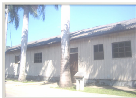
FIGURA 6 (dir.)

Locomotiva do acervo. (abril de 2009).