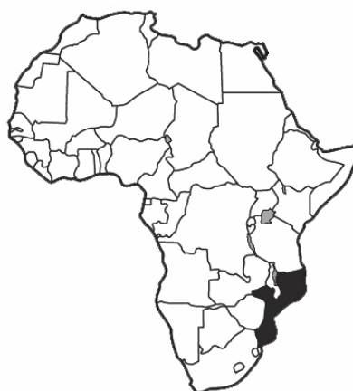
FIGURA 1 - Mapa ilustrativo da localização geográfica de Moçambique.

10° 27' e 26° 52' de latitude Sul e entre os meridianos 30° 12' e 41° 51' de latitude Sul, possuindo uma área de 799.390 km 2 , sendo a sua maior parte constituída por um planalto pouco elevado. A sua população é estimada em 19.888.701 milhões de habitantes (INE, 2006).