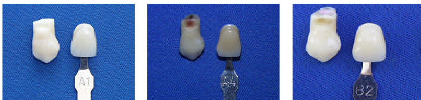
FIGURA 2 - Dentes do Grupo 1 em comparação com escala VITA: com a cor natural (A1), escurecidos (A4) e após técnica de clareamento (B2).