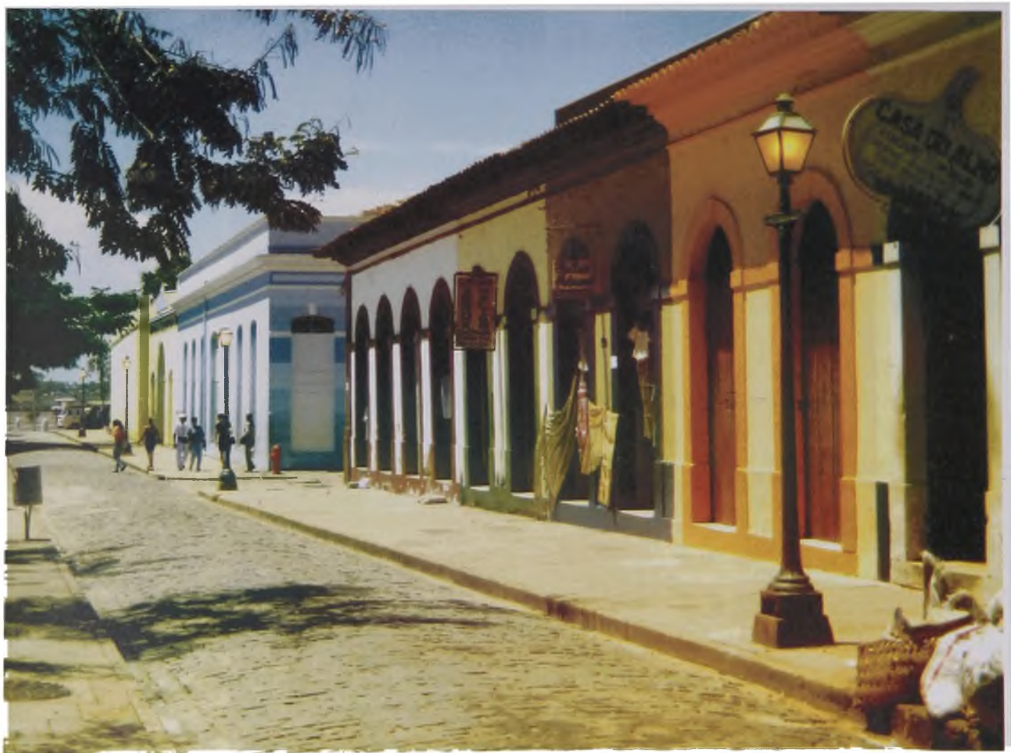
Figura 9 - São Luís do Maranhão – A revitalização cênica Fonte: Francine Cramacho