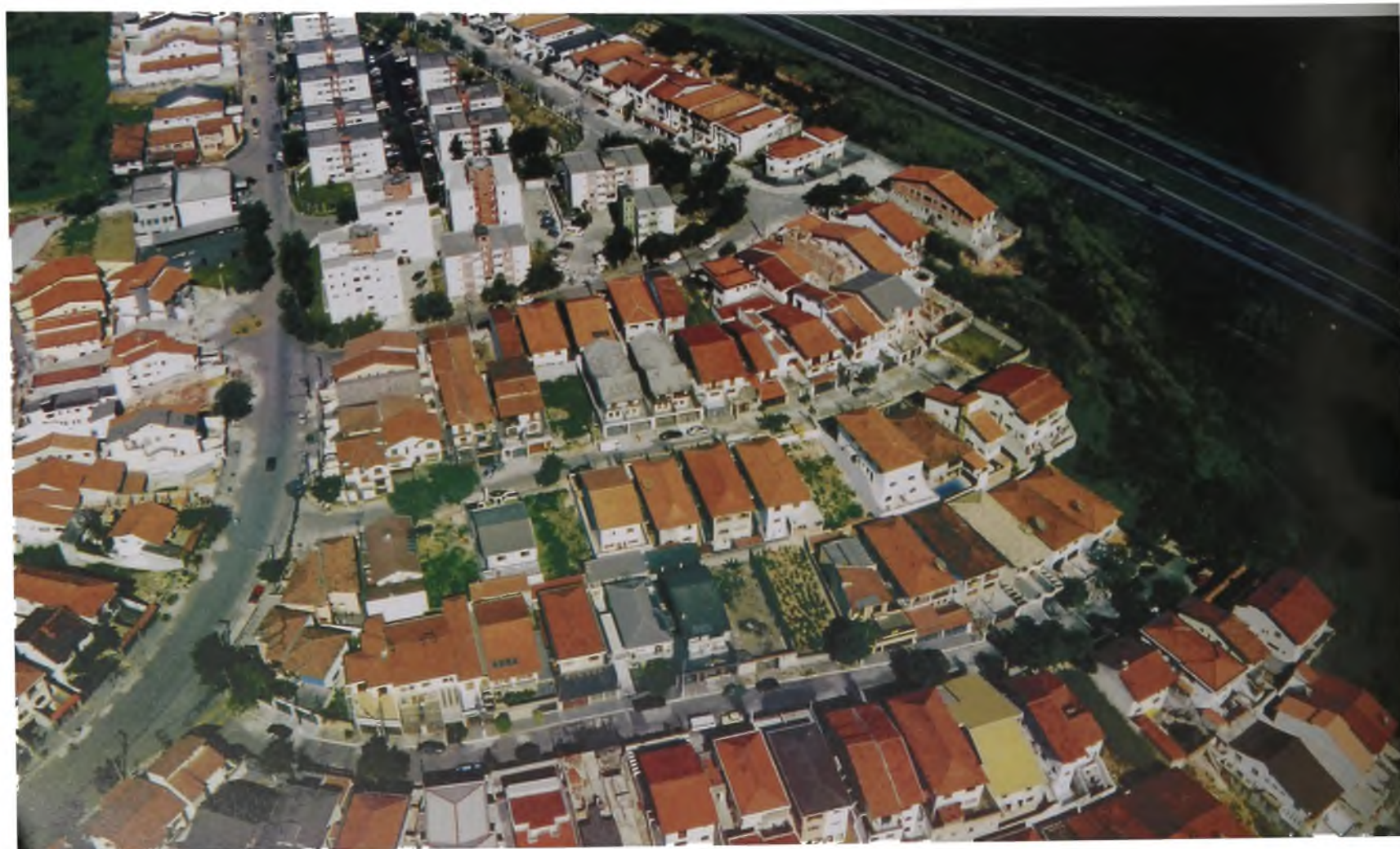
Figura 6 - Subúrbio classe média paulistana – Pirituba – SP

Observa-se, então, em volta das grandes cidades, a construção de anéis de chácaras de veraneio, que transformam áreas, antes agrícolas, em amenas e bucólicas áreas de lazer, e a edificação de linhas extensas de loteamentos de casas de veraneio ao longo da grande maioria da costa. Pode-se constatar, ao findar do século, um intenso processo de loteamento das áreas fronteiriças ao mar, que se posicionam, de um modo que tende ao contínuo, do estado do Rio Grande do Sul ao Ceará. São milhares e milhares de residências e centenas de loteamentos dos mais diferentes padrões, formas e tipos, que são construídos de um modo bastante destrutivo por (sobre) praias, dunas e áreas de restinga, causando a erradicação total da vegetação nativa e induzindo por muitas vezes a criação de paisagens totalmente padronizadas e diferenciadas da realidade até então existente.