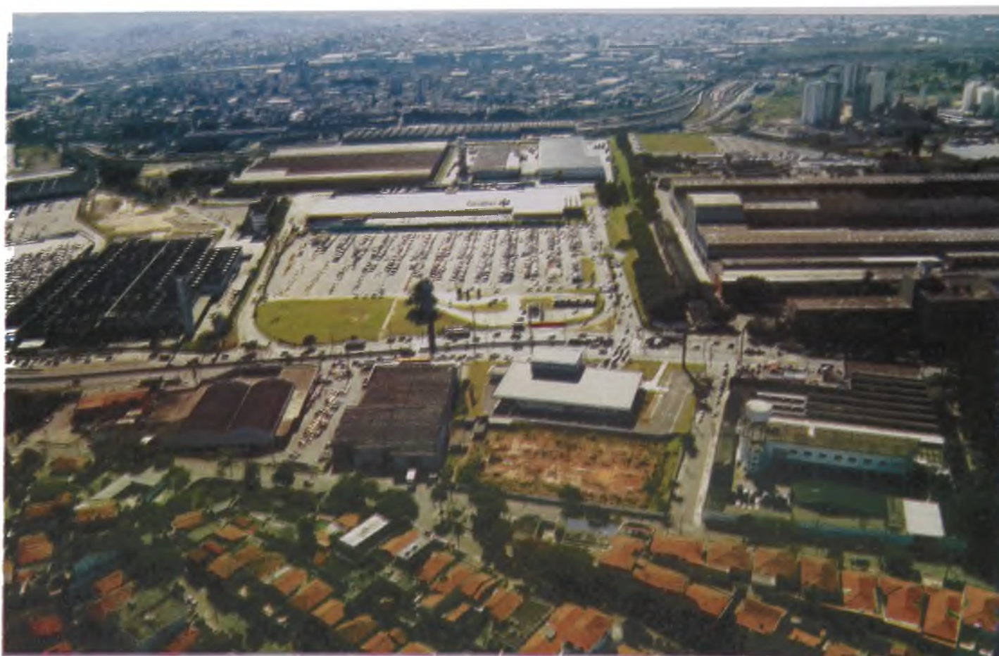
Figura 8 A - Centro de compras em Osasco/SP