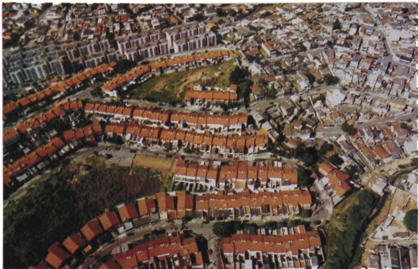
Figura 8 - Conjuntos e casarios – Subúrbio paulistano - Pirituba/SP

indiferenciadas no contexto geral, que abrigam atividades habitacionais, comércio e serviços, na maioria das vezes de configuração morfológica horizontal e, em alguns pontos, de configuração predominantemente vertical.