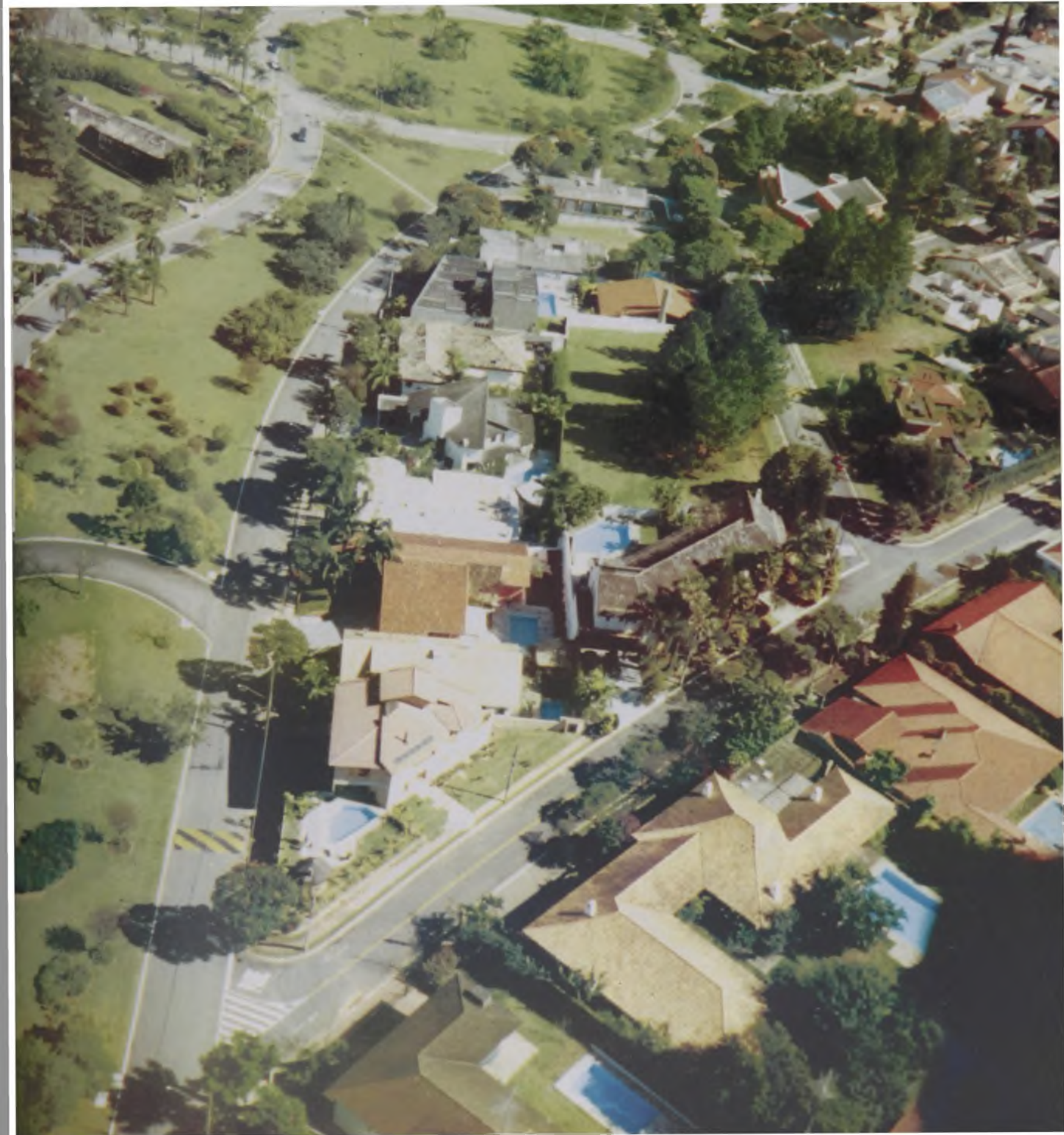
Figura 7 - Alphaville – condomínios verdejantes e segregados, Barueri – SP

Reproduzem-se, no litoral, os ideais urbanísticos da cidade tradicional, da casa cercada de jardins, o objeto mais importante na configuração da grande maioria dos loteamentos costeiros, ou das fileiras de prédios de apartamentos, que são alinhados em alguns pontos de maior demanda turística, como no Balneário Camboriú (SC), Vila Velha (ES) ou Guarujá (SP) em frente de uma avenida praiana, que pode ou não possuir um calçadão ou jardins.