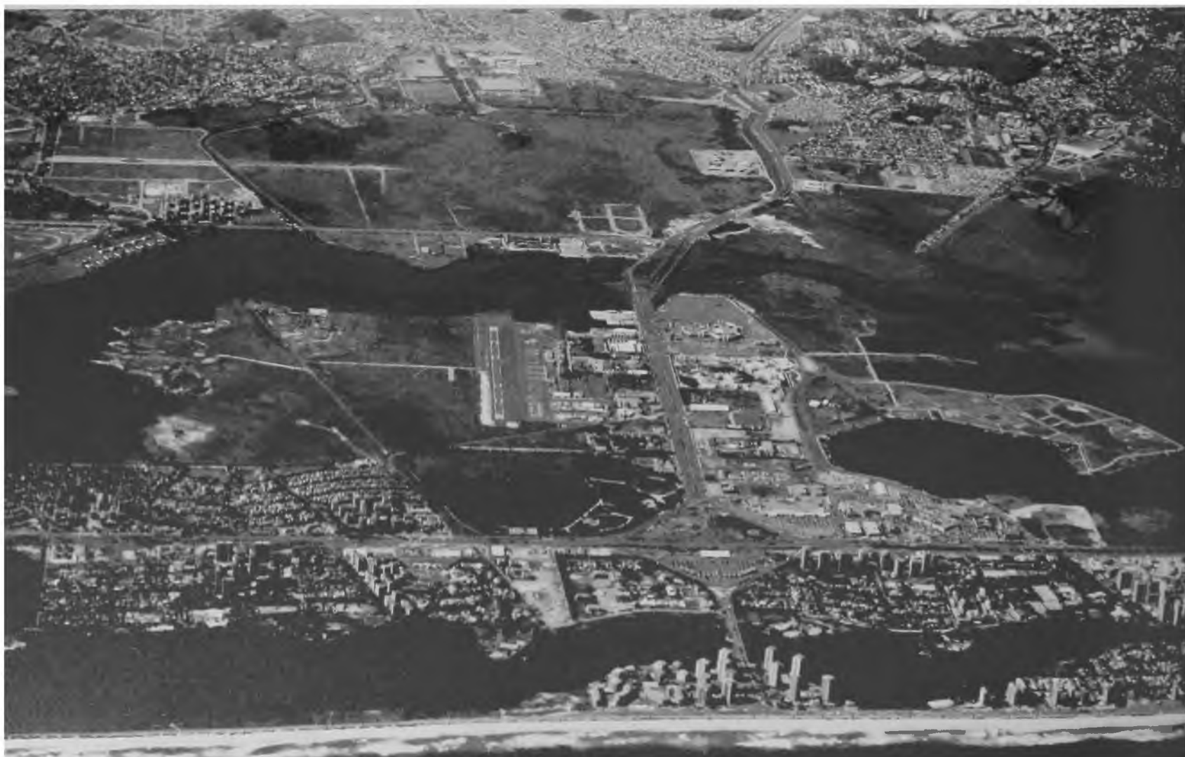
Figura 4 - Barra da Tijuca – Vista aérea Fonte: Foto do autor (1994)