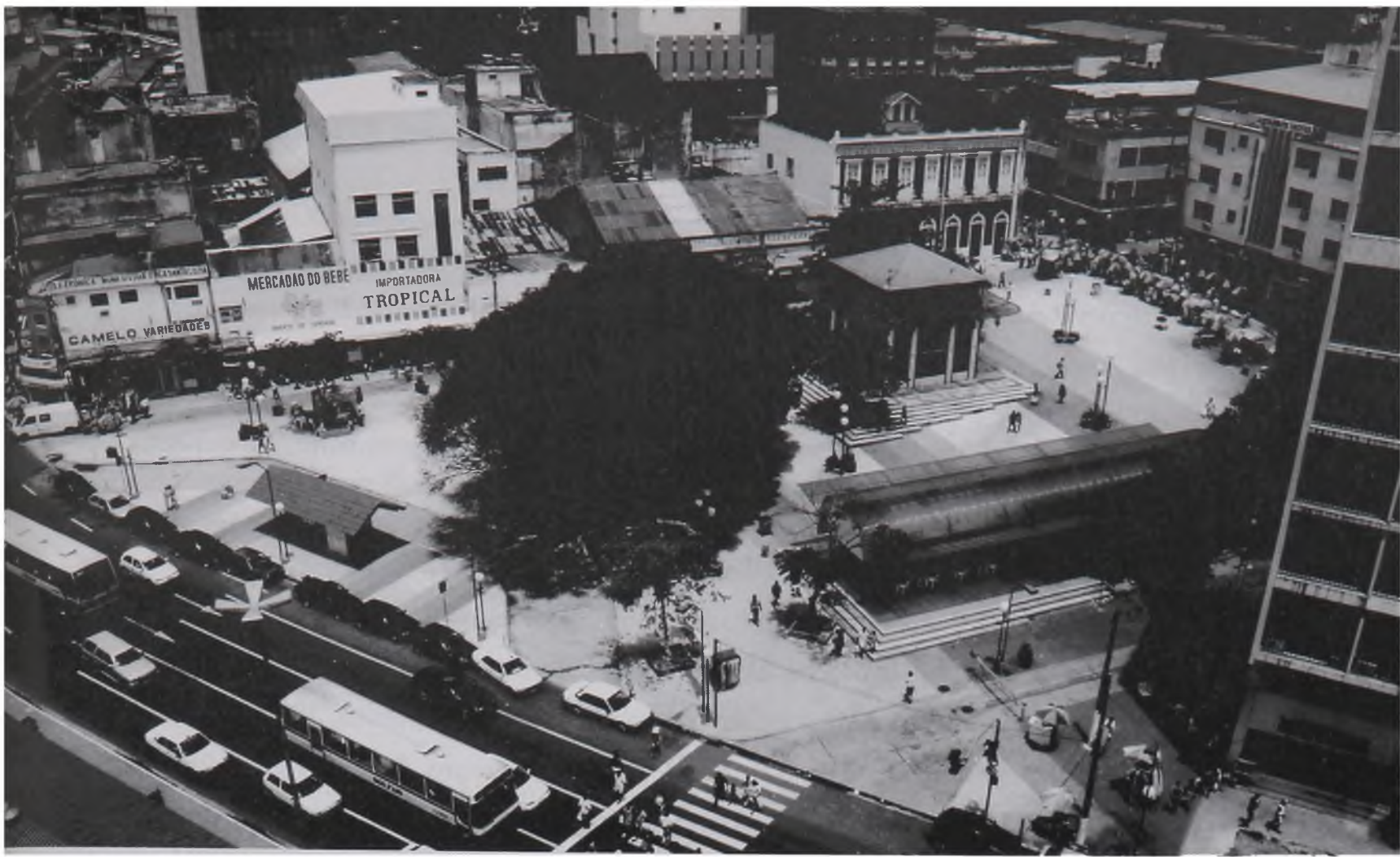
Figura 18 - Nova forma para a praça Ferreira Aranha – Manaus – Também um espaço para alimentação