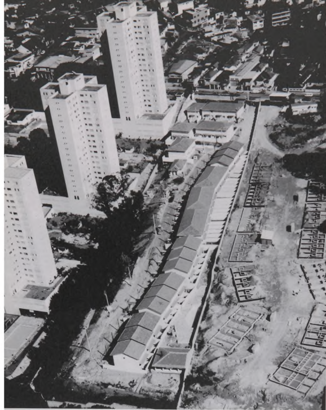
Figura 7 A - Vila em construção – SP Fonte: Foto do autor (set. 1998)