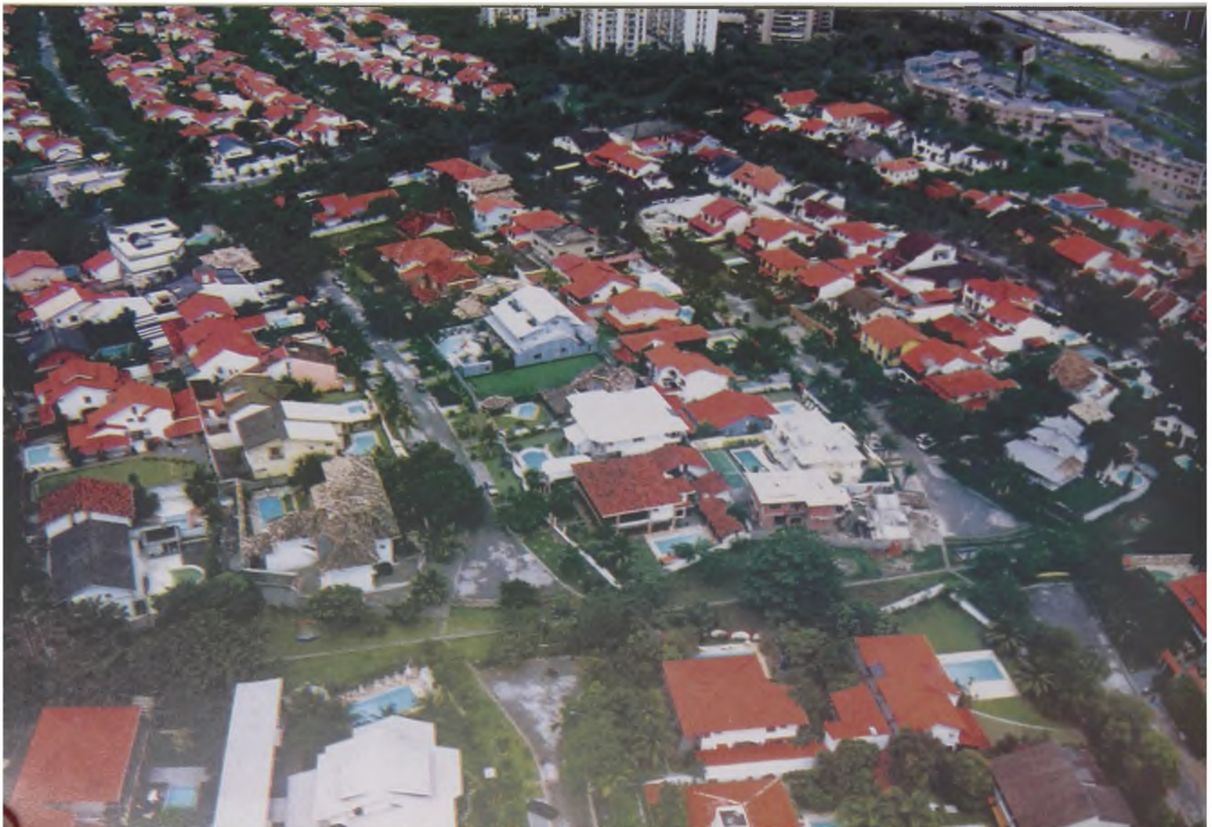
Figura 1A - Bairro Jardim – Barra da Tijuca Fonte: Foto do autor (fev. 1999)