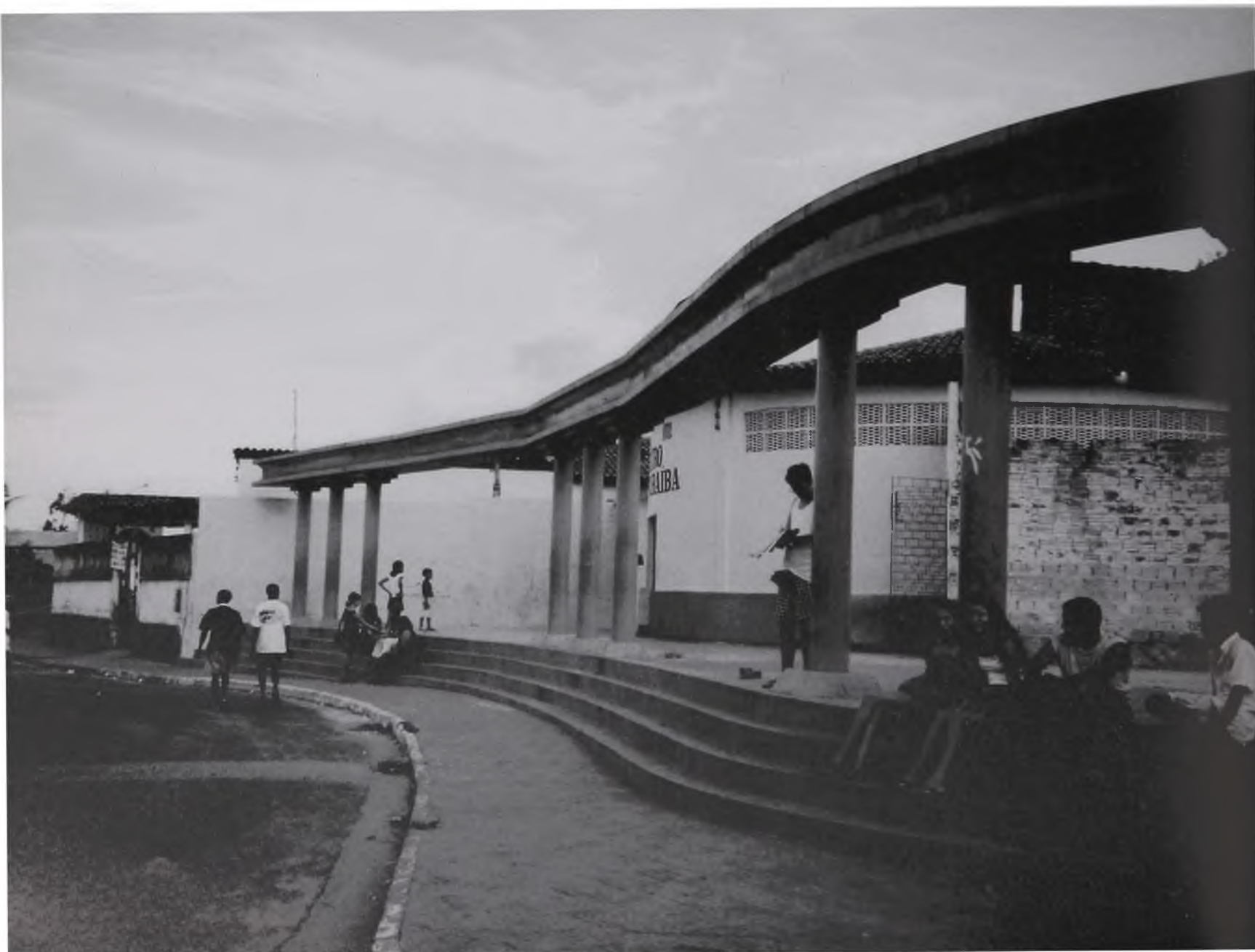
Figura 15 - Largo do Teatro – São Luís do Maranhão. O pátio frontal delimitado pelas colunas gregas

O restauro cenográfico de áreas centrais antigas com a pintura e a recuperação de fachadas, aos poucos, tornou-se uma prática comum, ora favorecendo a estabilidade funcional de alguns centros, caso do Rio de Janeiro (Projeto Corredor-Cultural) ou levando a um outro tipo de especialização, no caso para fins turísticos, como em Salvador. Elimina-se, neste caso de vez, possibilidades de uso diversificado e favorece-se algumas formas de segregação urbana, já que em tais áreas os usos são restritos e não interessa a sua apropriação por todos os segmentos sociais.