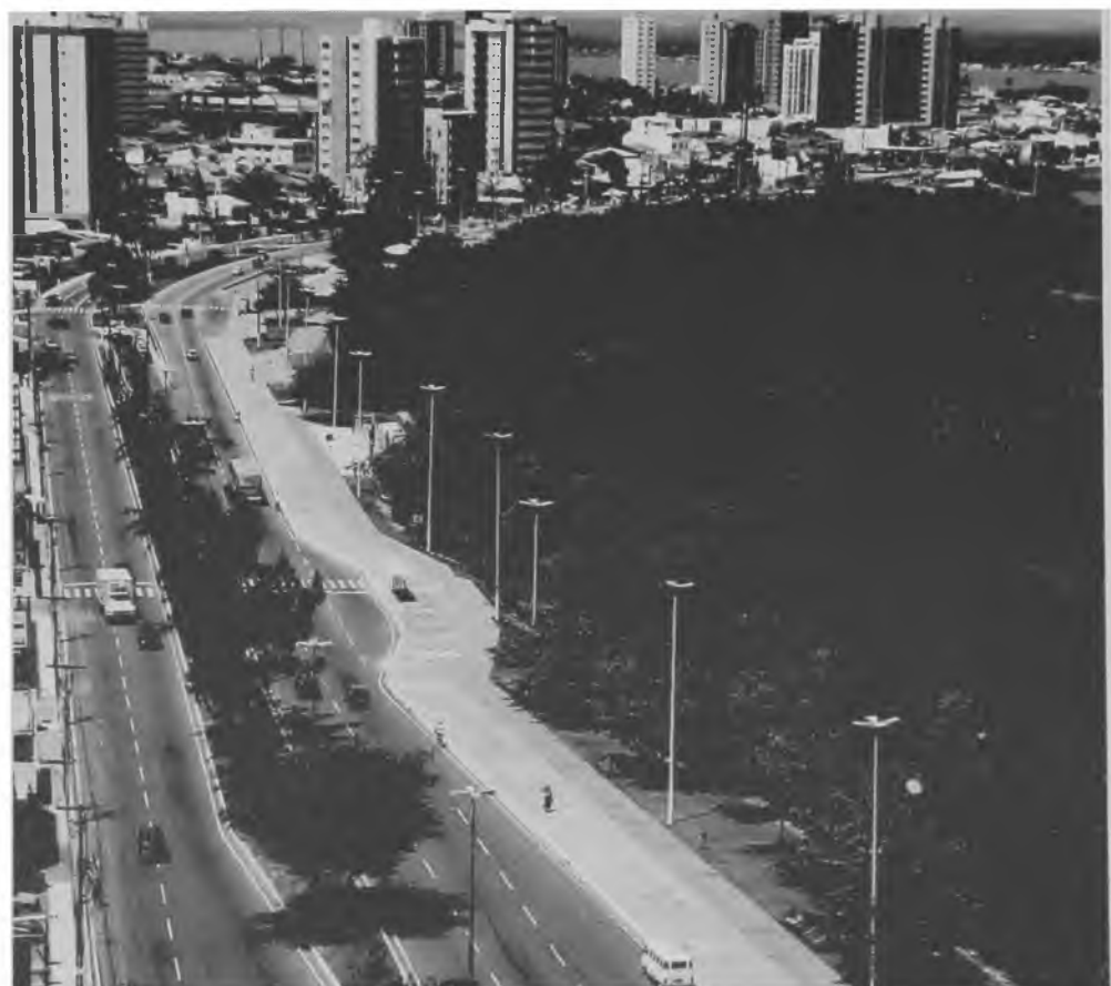
Figura 5 - Aracajú - Área nova verticalizada

○ processo de verticalização tradicionalmente se dá sobre áreas dotadas de infra-estrutura implantada e consolidadas, substituindo as construções existentes por outras tantas novas, especialmente em áreas ocupadas pela camada de maior poder aquisitivo, para as quais, em geral, são destinados os novos prédios de apartamentos. Somente nas últimas décadas do século, em algumas áreas novas, observa-se um processo de urbanização verticalizada, como é o caso da Barra da Tijuca, na cidade do Rio de Janeiro, do condomínio Riviera de São Lourenço, no litoral norte de São Paulo, ou em algumas áreas de Aracajú, São Luís do Maranhão e Salvador.