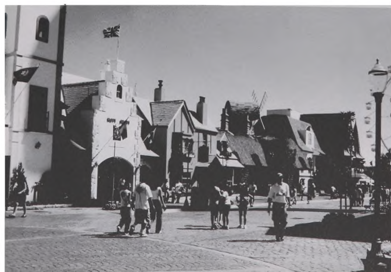
Figura 7 A 1 - Parque Temático Hopi Hari – SP