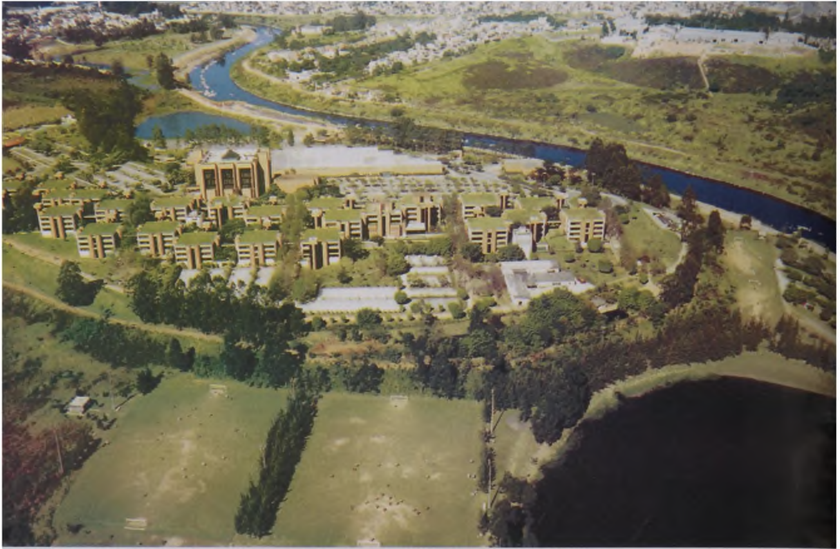
Figura 1 - A construção de novas paisagens sobre áreas já intensamente transformadas – Alphaville – SP