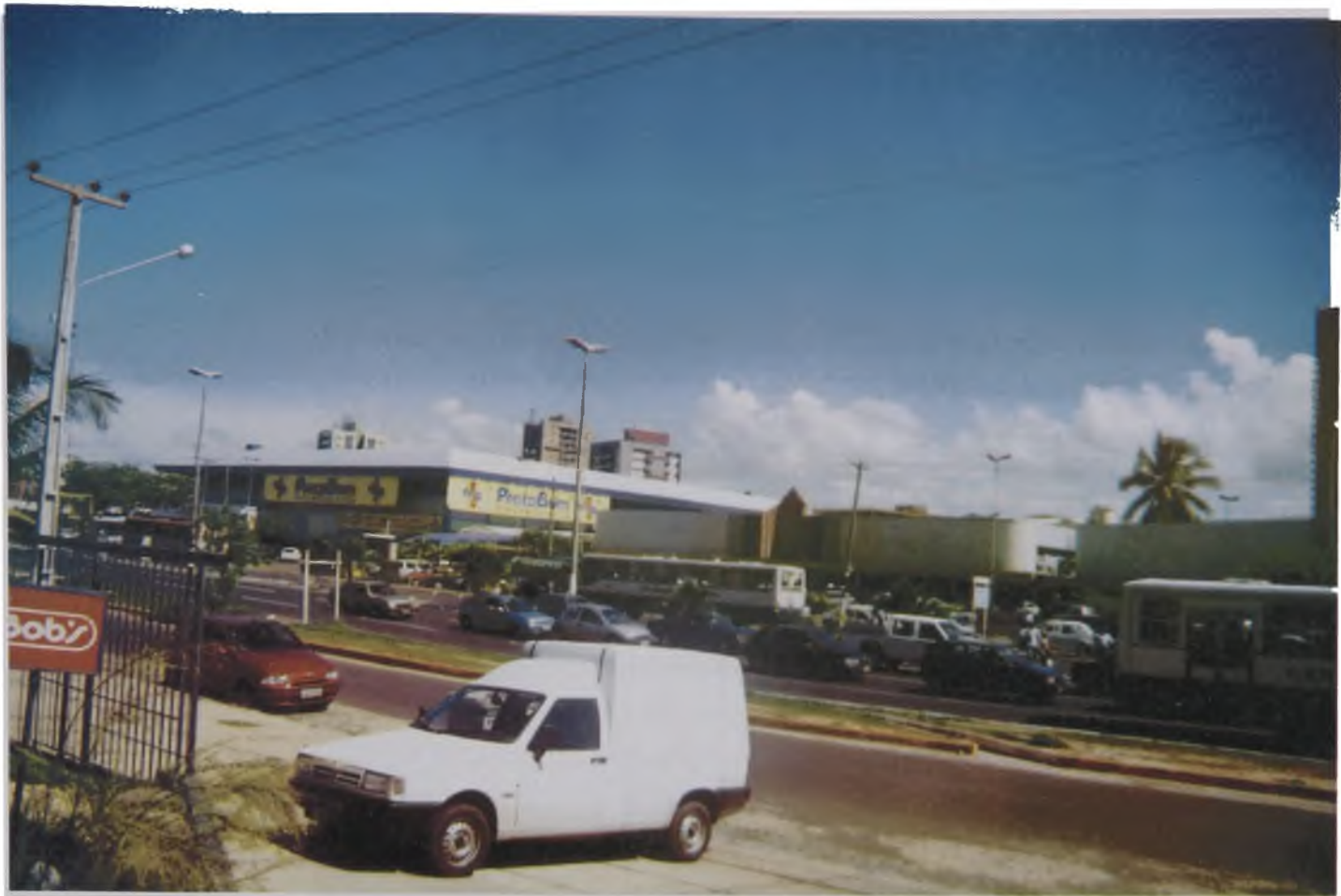
Figura 8 B - São Luís do Maranhão. Como em todas as grandes e médias cidades do Brasil, as avenidas e o comércio são estruturados para o automóvel