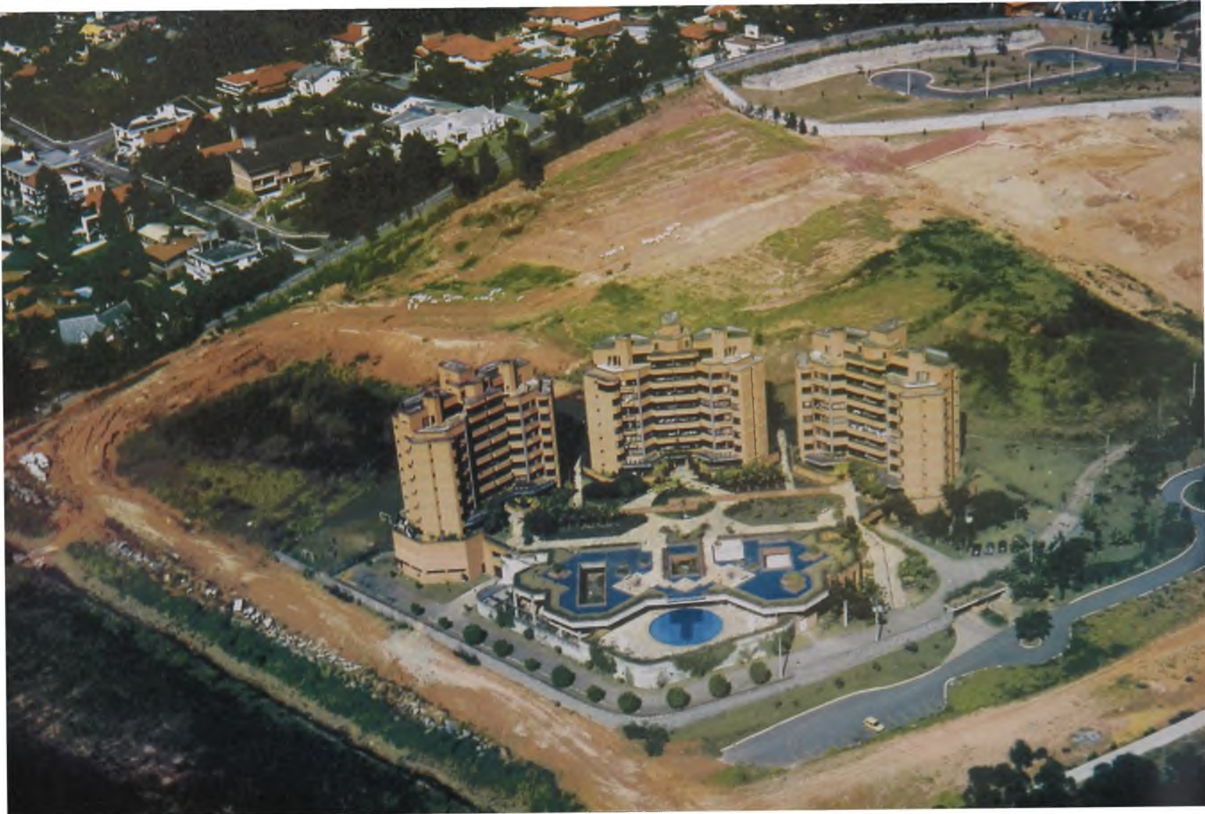
Figura 11 - Novas áreas – grandes terrenos, a reconstrução e o ajardinamento – Alphaville – Barueri – SP Fonte: Foto do autor (1998)

Não existe a morte do espaço público, mas a recodificação e a especialização de suas formas de apropriação, que são adequadas às formas de arranjos sociais que se configuram. Não se pode, por exemplo, dizer que uma rua de área central tomada por vendedores ambulantes, os populares camelôs, esteja morta, mas sim que não é mais destinada para o uso das elites, para o seu flunar ou para suas compras.