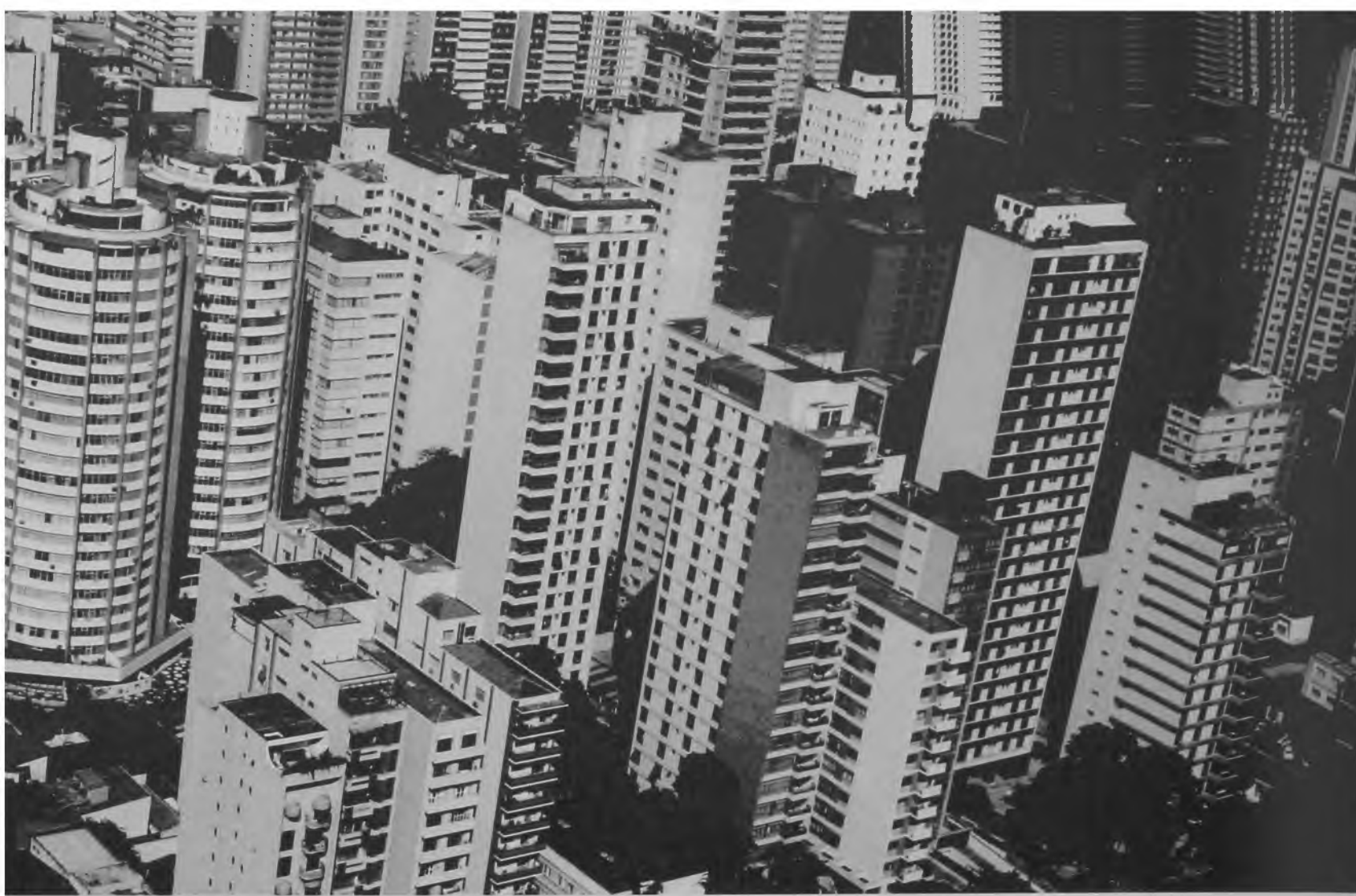
Figura 3 - Verticalização na avenida Faria Lima