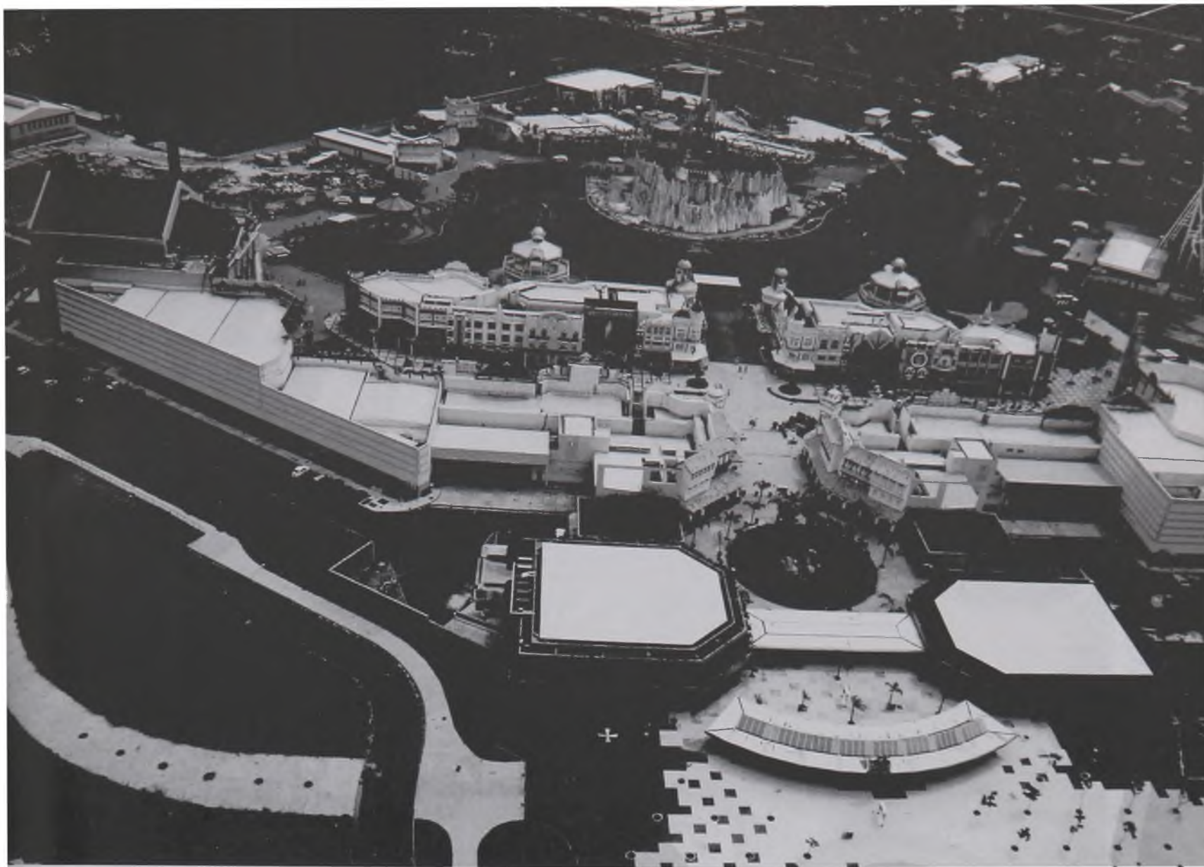
Figura 7 B - Parque Temático, Terra Encantada, Barra da Tijuca (vista aérea), RJ

No interior, nas estâncias turísticas de montanha, outros ideais balizam a construção da paisagem, baseados na reprodução de cenas bucólicas das montanhas de países como a Suíça e a Áustria. Pinheirais e chalés e prédios de tetos inclinados e prontos para receber uma improvável neve são altamente valorizados, já que se associa, tradicionalmente, desde os tempos do segundo império, a idéia do veraneio ou da temporada invernal nas montanhas, a uma intenção hipotética de flunar por paisagens europeizadas. As cidades de Campos do Jordão (SP) e Petrópolis (RJ) apresentam nas suas paisagens trechos significativos, configurados dentro destes parâmetros.