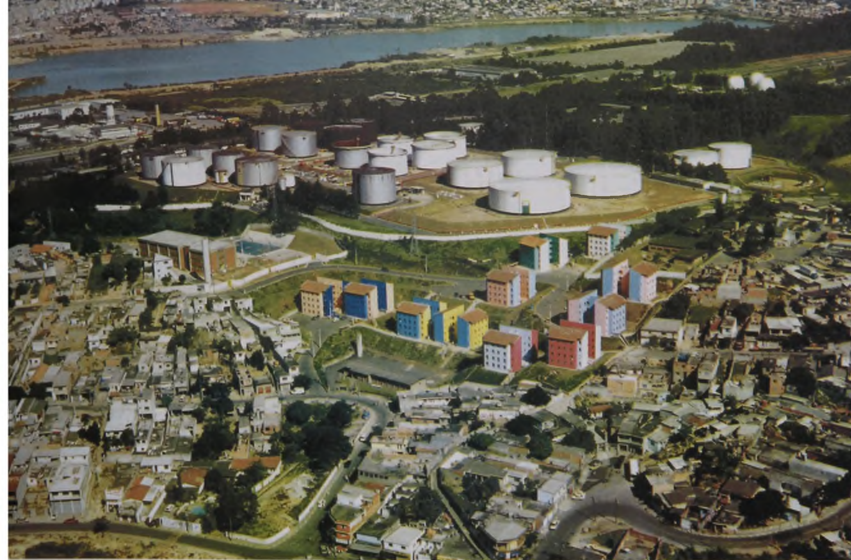
Figura 2 - Casario e indústrias – Barueri/Osasco/Alphaville (1998)