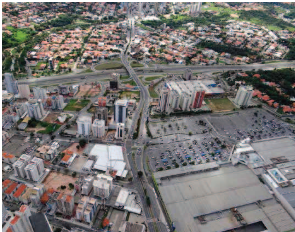
Área comercial em Sorocaba, SP, Brasil.

A cidade brasileira passou por mudanças drásticas nos últimos trinta anos e não é a mesma em relação às últimas décadas do século XX. Apresenta-se muito espraiada, dispersa funcionalmente e, muitas vezes, fisicamente. Expande-se de modo ora contínuo, ora fragmentado, sendo constantemente reestruturada para comportar milhares de novos veículos que chegam a suas vias, facilitam a mobilidade de alguns segmentos da população e favorecem a criação de formas (há não muitos anos inéditas) com avenidas e estradas ladeadas por shoppings centers , outlets , supermercados, lanchonetes e tipos de comércio estruturados para receber consumidores motoristas.