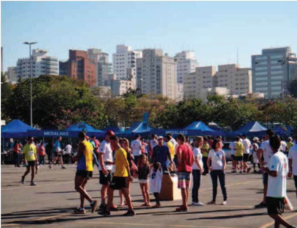
Caminhada no parque do Ibirapuera, São Paulo, SP, Brasil. Foto: Silvio Macedo – 2014

Neste século, com a legislação ambientalista consolidada após a Constituição de 1988, o número de áreas urbanas de proteção ambiental, parques e áreas de conservação aumentou – estas possibilitando a criação de sem-número de novos parques, especialmente parques lineares. Extremamente valorizada, a arborização urbana, em especial o uso de espécies nativas, ainda não se consolidou.