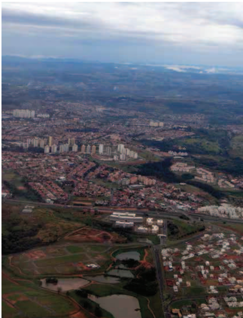
Loteamentos fechados na região da Grande Campinas, SP, Brasil. Foto: Silvio Macedo – 2014

Ipanema, Leblon e Copacabana na capital fluminense; Jardins, Higienópolis e Vila Olímpia na capital paulista. Paralelamente, com o amuralhamento de loteamentos e condomínios e o fechamento por muros altos ou gradeamento, aumenta a segmentação de setores urbanos expressivos – processo cada vez mais crescente, que atinge grande parte do território das cidades.