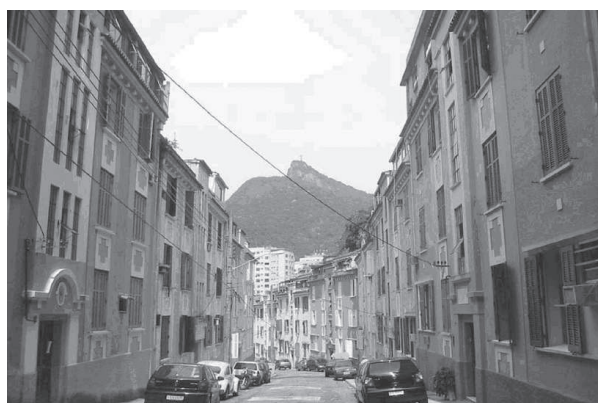
Figura 9: Vista da rua a partir do cul-de-sac

Em 1972, retornei à Pires de Almeida, onde residi até meados de 1974 com meus tios. Meu quarto, nos fundos, com vista para o Corcovado e o edifício Águas Férreas, transformou-se em um mundo novo de descobertas. Nesta época, uma das coisas mais pitorescas do lugar era o ‘cuco’, um senhor gentil e bem-humorado que, a partir das 21:30 horas, invariavelmente abria sua janela de tempos e tempos e, delicadamente, lembrava aos jovens que conversavam animadamente na pracinha: ‘são nove e meia!’ .... ‘são dez horas!’ Também me encantava o barulho das folhas das amendoeiras da praça, o canto dos passarinhos e os micos.