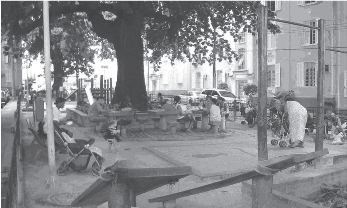
Figura 5: Praça Mucio Leitão, amplamente usada todos os dias para o lazer infantil

Na medida em que nos aproximamos da praça o ambiente se tornou cada vez mais aconchegante e calmo; com o frescor da manhã e da sombra das amendoeiras, as crianças brincavam alegres. Além dos pequeninos, mães e idosos conversavam entre si e com os vizinhos que, de suas janelas e sacadas, também animavam o ambiente. A praça é protegida com uma grade de ferro baixa que impede a entrada de cachorros. A maior parte das crianças brincava solta e livre, sem o risco de contato com os animais e seus dejetos. Suas vozes e gritos, ao reverberarem nas paredes dos edifícios que circundam a praça, produzem uma agradável paisagem sonora. O ar fresco sob a copa das árvores torna o ambiente adequado para caminhar e conversar. Não notamos a presença de odores desagradáveis; a sensação de “ar limpo” é acentuada, talvez devido à quantidade de árvores na praça (Figuras 2 e 5).