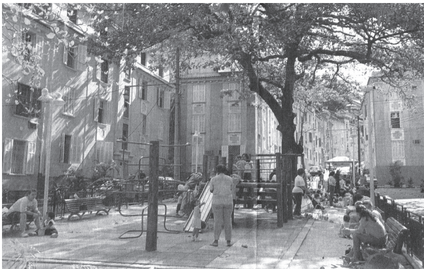
Figura 2: Foto da Praça Múcio Leitão

“a tranquilidade e a segurança da vila fazem com que crianças e jovens possam brincar e conversar até altas horas na pracinha, eleita o point do lugar. “Todos os meus amigos estão aqui. Todo mundo se conhece e eu posso ficar até uma, duas horas da madrugada na pracinha. Aqui é muito tranquilo”, diz Cristiane Martins, 17 anos.” 12