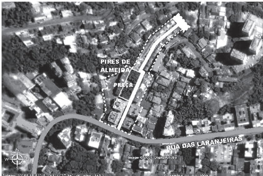
Figura 1: Localização do conjunto arquitetônico da rua Pires de Almeida

Como objeto de estudo escolhemos a rua Pires de Almeida, em Laranjeiras (Figura 1), em função de sua escala, de ser um dos quatro estudos de caso da pesquisa Desenho Urbano e Qualidade do Lugar 3 que originou o presente estudo, e pelos seus atrativos reconhecidos e apreciados pelos moradores e usuários, que se refletem no valor de comercialização no mercado imobiliário da cidade do Rio de Janeiro.