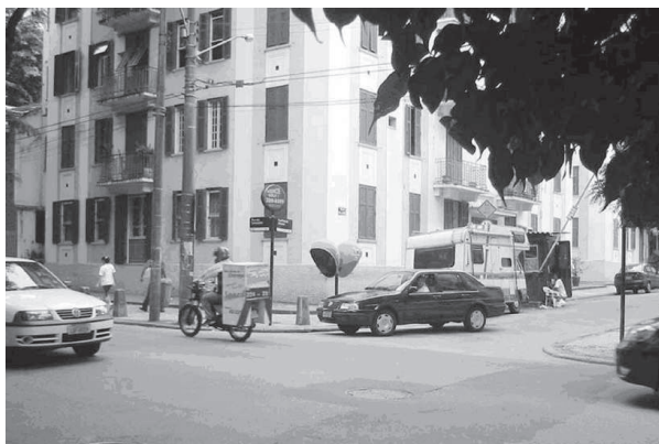
Figura 3: Esquina com a rua das Laranjeiras/ Edifício n. 7 13

Ao longo do percurso percebemos três setores com aspectos distintos: no início a presença de uma guarita com cancela, para o controle de veículos, dá a impressão de ser um condomínio fechado (Figura 3). No primeiro setor, observamos que os edifícios são todos alinhados com a rua e têm cinco pavimentos com suas fachadas pintadas na cor branca e em cores em tons pastéis, janelas de madeira nas cores branca e verde, venezianas com abertura para o exterior. Estes atributos transmitem a sensação de estarmos entrando em uma cidade do interior relativamente antiga (Figura 4).