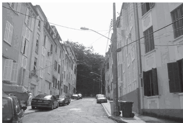
Figura 7: “Setor popular” com o cul-de-sac sob a densa arborização