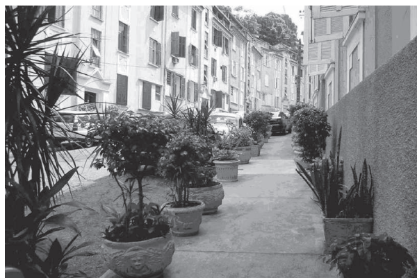
Figura 6: Início do “setor popular” do conjunto

Relato A – “conheço a rua Pires de Almeida desde 1958, quando tinha sete anos de idade, quando passava as férias de julho no edifício número 15, na casa de meus tios. Já no primeiro contato, fiquei fascinado com a pracinha, com as garagens do lado sul e com o marcador dos andares do elevador, um ponteiro e números de bronze que girava como um relógio. Passei três férias de julho neste apartamento, onde podia ver televisão – ainda inexistente no Rio Grande do Sul – e ler as revistinhas compradas na banca da esquina – outra novidade para mim. Nesta época, sem o acesso ao túnel Rebouças, a rua das Laranjeiras era bem mais tranqüila e bucólica, com seus bondes e lotações.