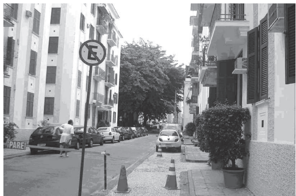
Figura 4: Vista junto ao Edifício n. 8

Avançando em direção ao interior, no segundo setor que contém a praça, observamos pessoas tranqüilas circulando – em geral mulheres guiando carrinhos de bebês, passeando com seus cães ou saindo para o trabalho. Suas expressões serenas demonstram o quanto o ambiente influencia seu cotidiano: rua arborizada, pouco barulho, boa iluminação e ventilação, microclima agradável e uma sensação de segurança. A Pires de Almeida é uma rua simpática e acolhedora.