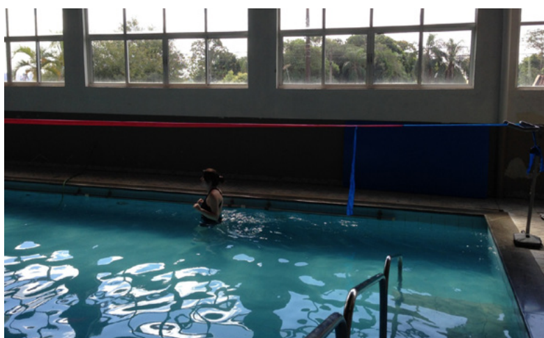
Figura 1. Teste de caminhada de três minutos aquático (TC3minA)

O teste foi realizado pelo menos duas horas após as refeições. Os participantes foram informados a utilizar roupas próprias e confortáveis para o ambiente aquático. Antes da realização do teste eles fizeram repouso de 10 minutos, durante esse período foram avaliados a PA, nível de dispnea e cansaço de membros inferiores por meio da escala de Borg modificada 20 , SpO 2 e FC. A FC máxima foi calculada segundo a fórmula de Karvonen (220 – idade) 22 .