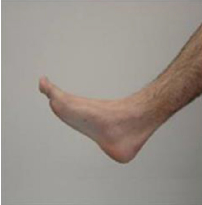
Figura 2. Exemplo de imagem projetada para identificação

forneceu o tempo decorrente para identificar o pé e o número de acertos 12 .