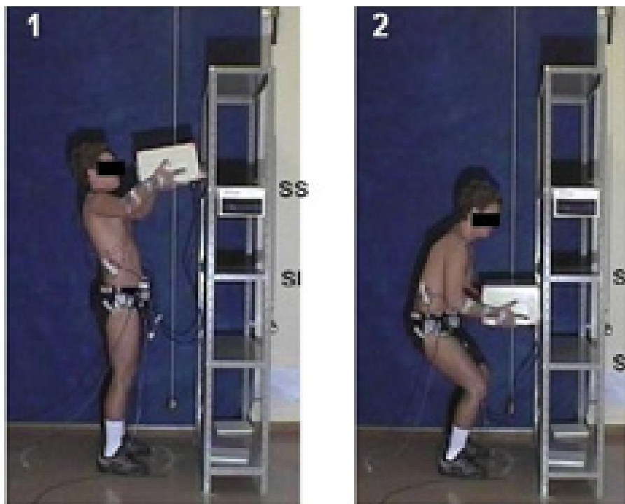
Figura 1 Tarefa de manuseio avaliada: A, levantamento, B, abaixamento; SS = Superfície superior com altura de 140 cm; SI = Superfície intermediária, altura 99 cm; SIn = Superfície inferior, altura 59 cm