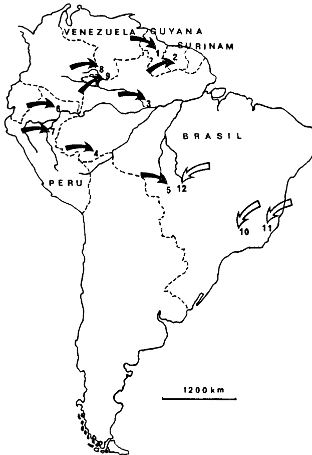
Figura 2 - Distribución geográfica de Thlastocoris laetus Mayr y de Lybindus dichrous Stal. Thlastocoris laetus (flecha negra) en Guyana: (1) y Surinam: (2) sin localización precisa (Mayr, 1866, O'Shea, 1980, in Brailovsky 1990); en Brasil: (3) Manaus y alrededores (colectas G. Couturier y Museu Nacional - RJ) (4) Rio Branco (colección CIIF) (5) Cuiabá, Chapada dos Guimarães (colección CIIF); en Perú: (6) Iquitos y alrededores (7) Jenaro Herrera (Brailovsky, 1990, y colectas de G. Couturier y H. Inga); en Venezuela: (8) San Carlos de Rio Negro y (9) San Simón de Cucuy (Brailovsky, 1990). Lybindus dichrous (flecha blanca) en Brasil: (10) diversas localidades en el Estado de São Paulo (Mariconi, 1953), (11) Santa Teresa, Estado de Espírito Santo (colección CIIF), (12) Cuiabá (Mariconi, 1953; Brailovsky, 1984).

en tanto que los segmentos dorsales del abdomen V a VII son negros; el tylus está conspicuamente en declive (Fig. 1a).