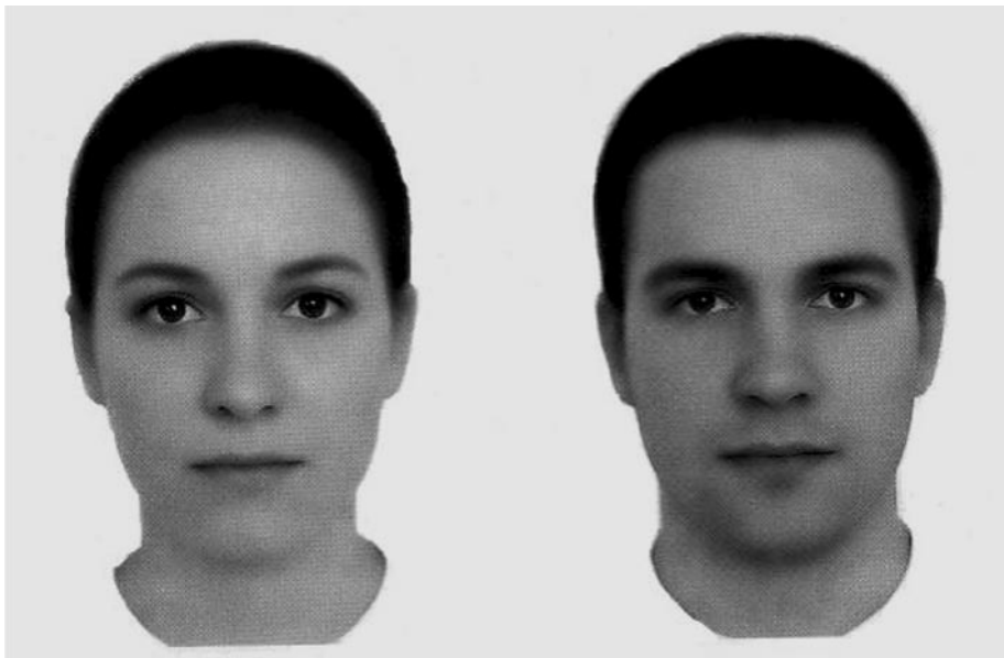
FIGURA 02 - Rostos padrões obtidos por meio da técnica de morphing a partir de 64 originais femininos e 32 masculinos (Gründl e col., 2001, p. 08)

Depois de obterem o padrão morphing , os pesquisadores retornaram com as imagens para apreciação do grupo de sujeitos selecionados para avaliação. O resultado registrado: quanto maior o número de rostos originais contidos no padrão fotográfico, mais atraente era para os pesquisados (Gründl e col., 2001).