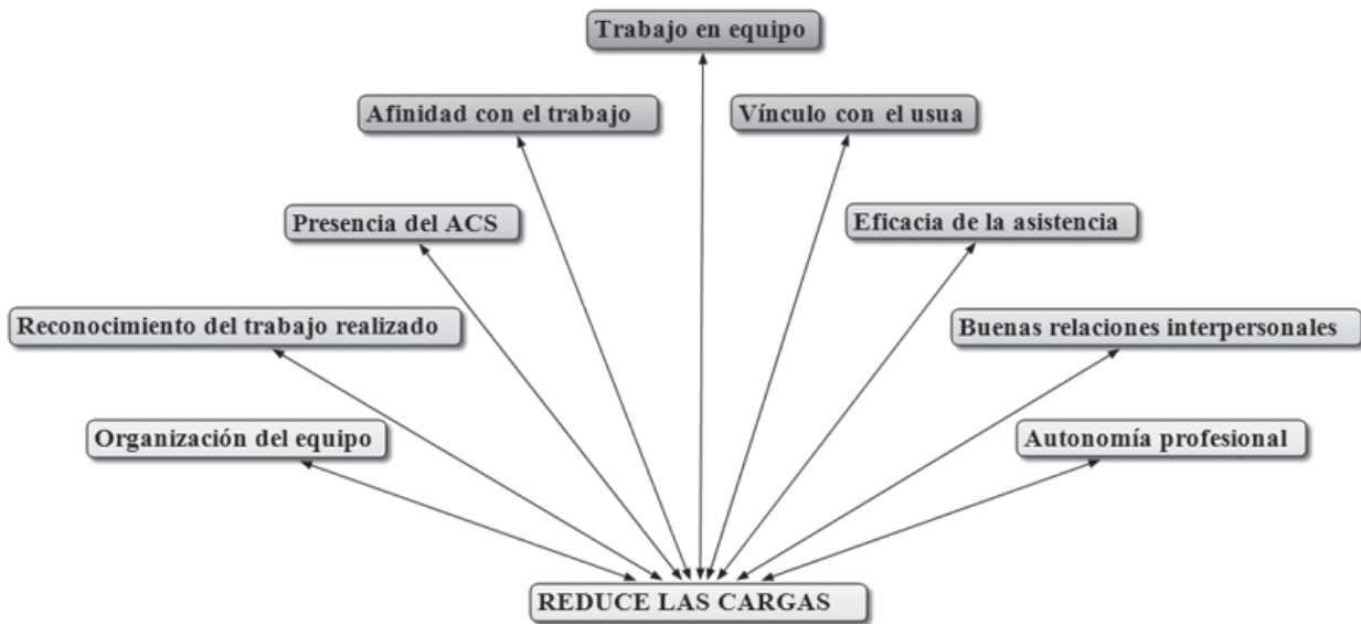
Figura 2 – Principales elementos que reducen la carga de trabajo de los profesionales de enfermería

Los relatos de los profesionales muestran que el trabajo en equipo, el vínculo con el usuario, la presencia de Agentes Comunitarios de Salud (ACS) y la afinidad con el trabajo contribuyen a la reducción de las cargas de trabajo. Los tres primeros elementos son parte de los requisitos de la ESF y se asocian con el code "afinidad con el trabajo", lo que sugiere que la identidad de los profesionales de la salud con el modelo de atención de la ESF ayuda a reducir las cargas de trabajo. También han contribuido a reducir las cargas: la organización del trabajo; el respeto a la autonomía profesional en el trabajo colectivo; la obtención de resultados satisfactorios; el reconocimiento por parte de los usuarios, compañeros de trabajo y la gestión por su trabajo, y las buenas relaciones de trabajo.