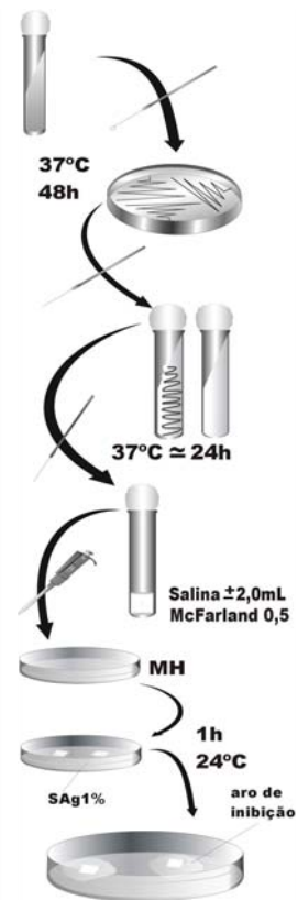
Figura 2 - Fluxograma de avaliação da atividade antimicrobiana das coberturas com sulfadiazina de prata a 1%

A Figura 2 apresenta o fluxograma de avaliação da atividade antimicrobiana das coberturas com sulfadiazina de prata a 1%.