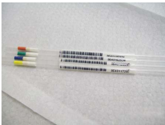
Figura 4. Palhetas utilizadas para armazenagem de material biológico.

Durante a fase de implementação houve muitos problemas tecnológicos e logísticos. A instabilidade da eletricidade e mesmo a falta de luz em quase todos os centros assim como as limitações no suporte de manutenção para os freezers foram uma preocupação importante durante toda a fase de coleta de dados. Na verdade, pequenas panes em alguns freezers mostraram a necessidade absoluta de um freezer backup em cada centro e de manutenção preventiva de todos os freezers em uso. Problemas decorrentes do aumento da temperatura e do nível de ruídos também foram identificados em alguns centros. Em relação aos problemas logísticos, os entraves para compra, a necessidade de alterações