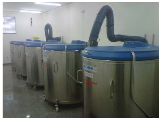
Figura 3. Tanques de nitrogênio líquido no biobanco central de São Paulo.

Cada biobanco local foi gerenciado por um coordenador e de um a três técnicos. Cada coordenador recebeu material detalhado sobre todo o processo de coleta e estocagem de amostras. Vários pré-testes foram realizados antes e durante o período de recrutamento do estudo organizados pelo comitê de laboratório. Os materiais distribuídos aos coordenadores de laboratório incluíram o manual instrucional do estudo, um fluxograma com o processamento do material biológico, kits de descrição com a coleta padronizada das amostras e de envio de materiais. Além disso,