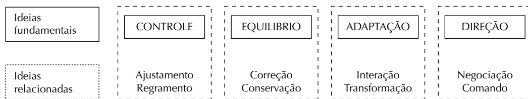
Figura 2. Ideias fundamentais e relacionadas aos conceitos de regulação.

A partir da aplicação da noção de regulação no campo das ciências da vida, destaca-se a incorporação de mais uma importante ideia, a de equilíbrio. Essa ideia está ligada a outras duas, a de conservação e a de correção. Nota-se que o emprego dessa ideia no conceito de regulação já estava difundido em diversas disciplinas, tais como economia, sociologia e ciências políticas. Essas disciplinas incorporam o conceito de regulação importando também os conceitos sobre sistemas (econômicos, sociais, políticos).