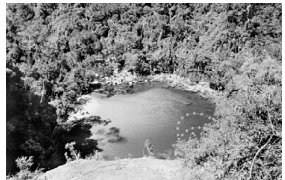
Figura 2 - Vista geral da Estação A, com destaque para o local de captura, Parque Nacional da Serra da Bocaina, Estados de São Paulo e Rio de Janeiro, Brasil.

Estação A – Próxima ao rio Mambucaba que, após formar a cachoeira de Santo Isidro, desce vertente abaixo até a cidade que lhe deu o nome. Esse é um dos pontos em que a vegetação se encontra melhor preservada, dando formação a uma mata ciliar relativamente fechada, com clima ameno, árvores com cerca de 25 m de altura e ornamentadas com bromeliáceas (Figura 2).