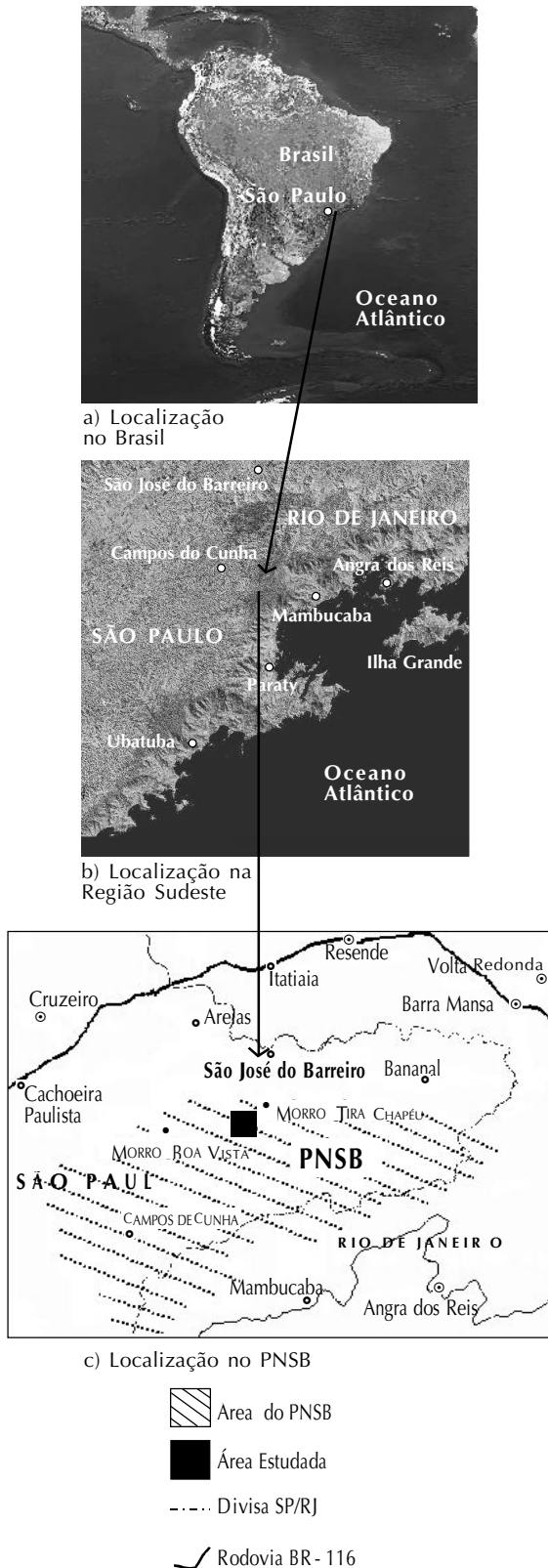
Figura 1 - Localização da área estudada no Brasil (a), na Região Sudeste (b) e no Parque Nacional da Serra da Bocaina (PNSB) (c).

Segundo as aferições climáticas obtidas para os campos de altitude do PNSB, no biênio 1991/92, as médias de temperatura e precipitação pluviométrica atingiram,