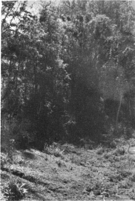
Fig. 1 — Reserva florestal que margeia o rio.

(Leal et al. 2 , 1961; Forattini 1 et al., 1970 e Pessoa & Vianna 4 , 1974). No Estado do Paraná, além de Curitiba, já foi assinalado em cinco localidades (Lima 3 et al., 1964). Em Cambé é a primeira vez que este fato é observado.