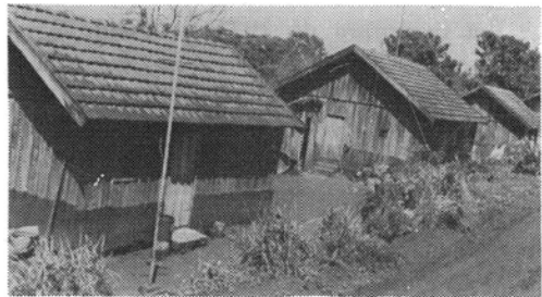
Fig. 3 — Localização das habitações existentes no sítio.